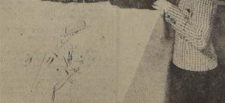
Tejidos de lana británicos

además porque pueden resultar útiles para cualquier hora del día. Otro favorito entre la gente joven, son los trajes de dos piezas que se usan igualmente de