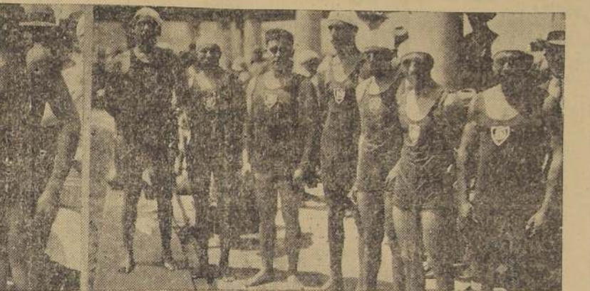
Los equipos de water-polo que definirán próximamente el campeonato de Chile: 1. El Green Cross que el Domingo último venció en Viña del Mar al Regatas de Valparaíso. — 2. El Deportivo Playa Ancha, de Valparaíso, que eliminó al Alemán de Santiago.