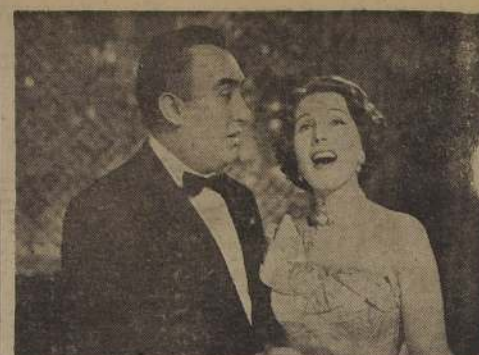
NOTABLES CANTANTES.— Libertad Lamarque y Pedro Vargas, considerados como los cantantes más populares de Latinoamérica, unen sus voces en "La marquesa del barrio", cuyo estreno se anuncia para el miércoles en el Cine Santiago.

aventuras del lejano oeste americano, filmada en technicolor, y llevando por intérpretes a Randolph Scott, Adele Jergens, y Raymond Massey, completará el programa. "Contra el imperio del crimen" y "Aurora de redención", serán exhibidas a contar del martes próximo en el Baquedano.