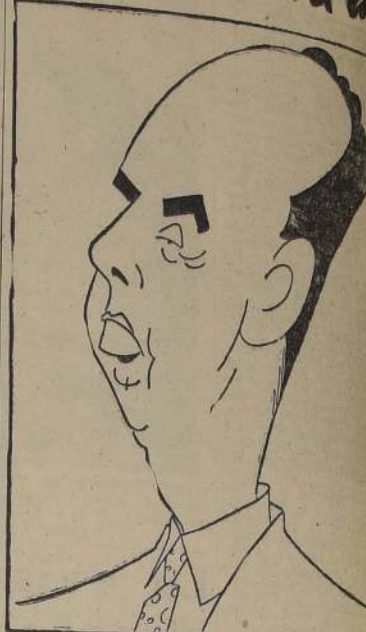
Don Pedro Enrique Alfonso, candidato presidencial de los de centro izquierda, cuya candidatura ha iniciado trabajos en todo el país, al constituirse el Comando Nacional.