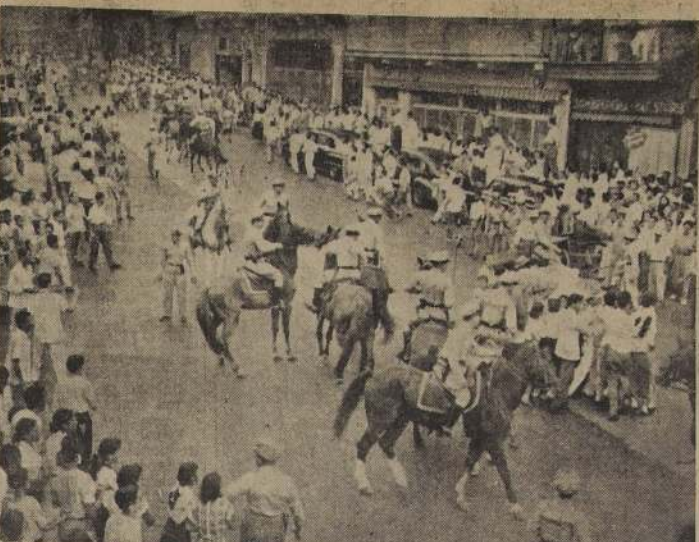
ALUMNOS DE HUMANIDADES PROVOCAN DISTURBIOS CALLEJEROS EN PANAMA.— CIUDAD DE PANAMA. Policía montada de la ciudad de Panamá dispersa a numerosos grupos de estudiantes de humanidades (secundarias) que formaron disturbios callejeros nuevamente para pedir la derogación del decreto que ordena el cierre de los colegios el 31 de enero último. Los estudiantes pedían que se les diera más tiempo y no se suspendieran las clases con el fin de poder preparar su exámenes finales de año. La huelga duró 77 días.— (Foto United Press).