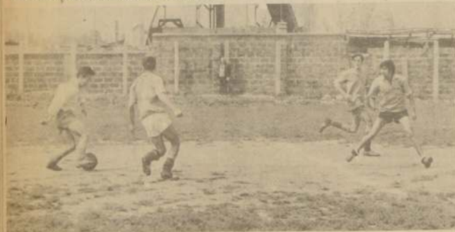
Avance del Sta. Mónica.