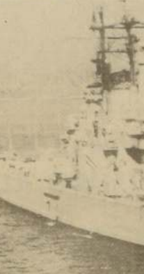
MANILA. Filipinas El poderoso crucero "Newport" de la Armada de Estados Unidos, que sufrirá una explosión en la torre de artillería (señalada con flecha) arriba a este puerto en que será sometido a reparaciones. La explosión se produjo cuando el navío cumplía misión de bombardeo frente a las costas de Vietnam.

Los huelguistas dijeron que la cantidad de pequeños comercios —de los cuales hay uno para cada 49 belgas— se redujo en un 18 por ciento en los últimos cuatro años.