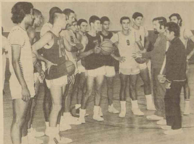
LA SELECCION JUVENIL peruana, que nos visitó para la cita internacional, conoce a los "villarrealinos". Ellos son y han sido el principal semillero.