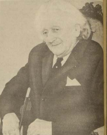
EDGARDO GARRIDO MERINO, Premio Nacional de Literatura.

Las obras personales que más satisfacciones le han brindado y por las cuales siente especial predilección son "El Hombre de la Montaña" y "El Dolor de