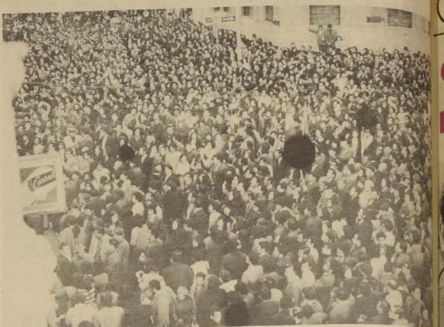
Miles de comunistas se reunieron en la tarde de ayer en las calles adyacentes a la sede política de esta colectividad que fuera criminalmente asaltada por provocadores derechistas el lunes en la noche. Los militantes del PC ratificaron en la combativa concentración su decisión de continuar luchando contra los que pretenden a este país a una situación de violencia y caos. En el acto, la senadora Julieta Campusano, vieja luchadora nortina.

De acuerdo a lo que se informó, Carabineros tenía totalmente controlada la situación.