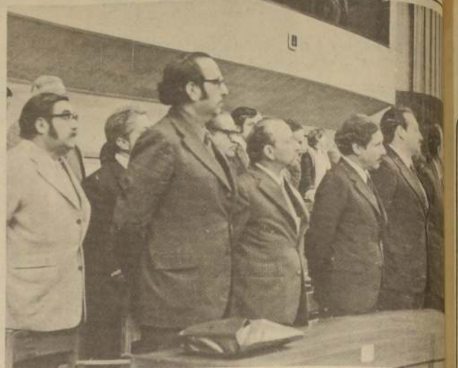
Las autoridades de la Salud durante una de las sesiones plenarias de la III Reunión Especial de Ministros del ramo de las Américas. En el grabado el Subsecretario de Salud, Dr. Car-

La reunión, con dos plenas, finalizó el lunes próximo.