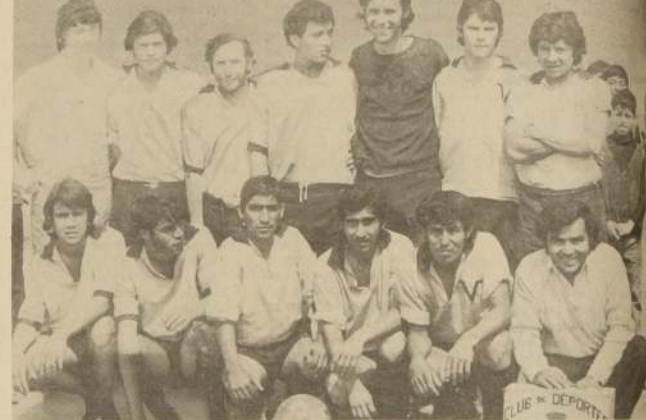
EL SEGUNDO en la tabla, Deportes Veloz.

En el partido, estelar N° 4 se midieron el puntero del torneo, Atlético Sta. Mónica con el campeón del campeonato de apertura de este año, que va al medio de la tabla "Cultural Audax", ganando el primero con los tres equipos por las cuentas de 1 a 0, 4 a 0 y 1 a 0.