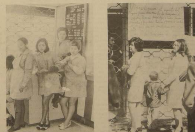
Parte del Personal del Café "Coppelia" se repone del susto antes de iniciar la tarea de reparar los destrozos.