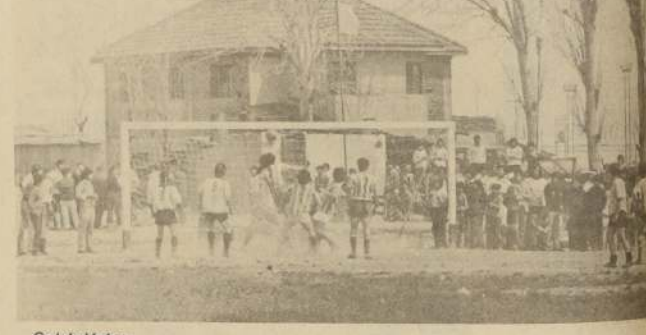
Gol de Veloz