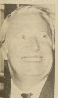
EDUARDO HEATH, Primer Ministro de Gran Bretaña.

Los huelguistas dijeron que la cantidad de pequeños comercios —de los cuales hay uno para cada 49 belgas— se redujo en un 18 por ciento en los últimos cuatro años.