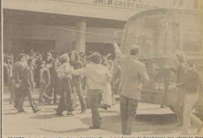
FRENTE al cine Normandie, los violentistas de Patria y Libertad y del Partido Nacional, insultan a las fuerzas de Carabineros que observan desde un furgón policial.