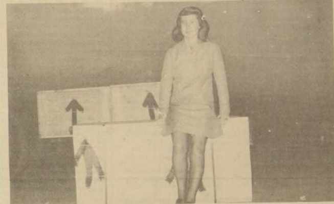
En el Jet de Canadian Pacific se embarcó el primer niño artificial chileno, que será presentado en el Quinto Congreso Mundial de Nefrología