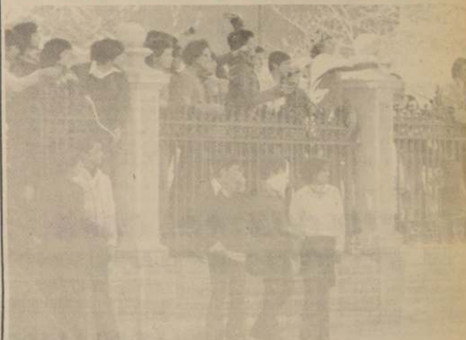
DESDE el interior del Congreso los provocadores de FESES lanzaron piedras a las fuerzas de Patria y Libertad y del Partido Nacional, insultando a las secretarías del Comité Socialista. Su hembra la reafirmaron al insultar groseramente a las secretarías del Comité Comunista y Radical.