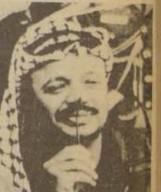
YASSIR ARAFAT, líder de las Fuerzas Palestinas de Liberación.

"Es nuestra meta —concluyó Torrijos— que los estudiantes de nuestro país tengan uniformes, zapatos y se alimenten tres veces al día, así como también darle al campesino la educación y los instrumentos de trabajo, necesarios para acabar con la miseria, las enfermedades y la desocupación".