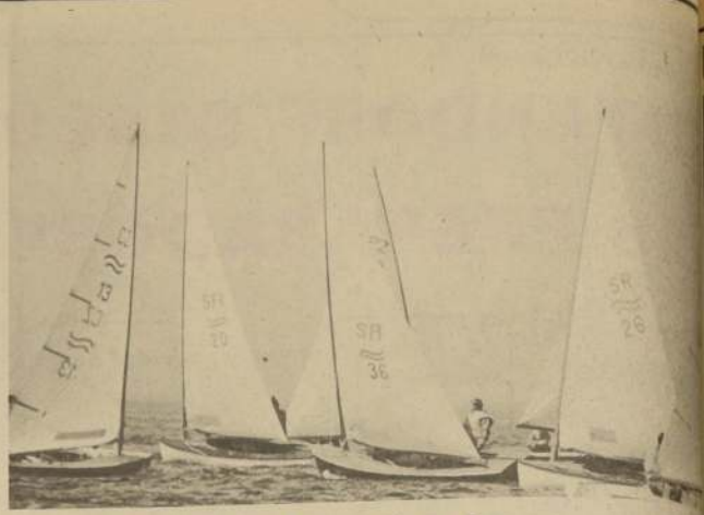
JUNIO DE 1971. Tallín "Regata del Báltico", yates tipo "Finn" compitiendo.