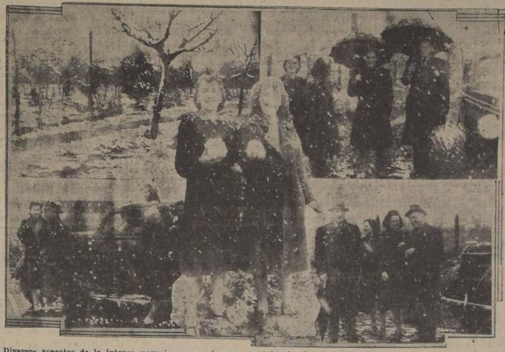
Diversos aspectos de la intensa nevazón que cayó ayer en el barrio alto de la ciudad. La nieve cubrió jardines, calles y caminos. Los automóviles pasaban con gruesas capas de nieve en los parabrisas y pasaderas y los paraguas quedaban enblanquecidos. Numerosas familias aprovecharon en esta oportunidad para trasladarse a ese sector, a fin de disfrutar del espectáculo que desde hacía años no presenciábamos en la capital.

EL INTENDENTE DE SANTIAGO EFECTUO UNA VISITA DE INSPECCION EN EL CAMINO AL VOLCAN. — EN LA MA- DRUGADA Y EN LA TARDE DE AYER NEVO INTENSAMENTE EN SANTIAGO