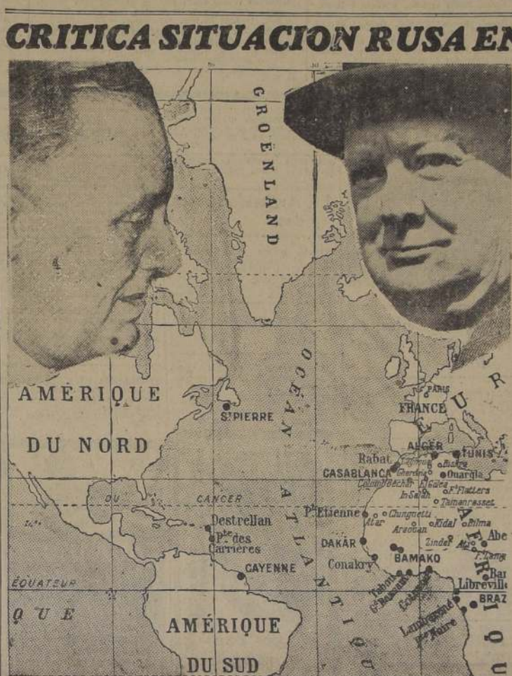
La reunión de mayor trascendencia entre estadistas de las potencias democráticas, fue la celebrada entre Roosevelt y Churchill, a bordo del "Prince of Wales". Con la declaración conjunta firmada por ambos, se ha hecho más estrecha la unión anglo-norteamericana en la lucha contra el Eje.

Alemanes anuncian que Odessa y Nikolaiev se encuentran rodeadas y que ocuparon la región minera de Krywoi Rog