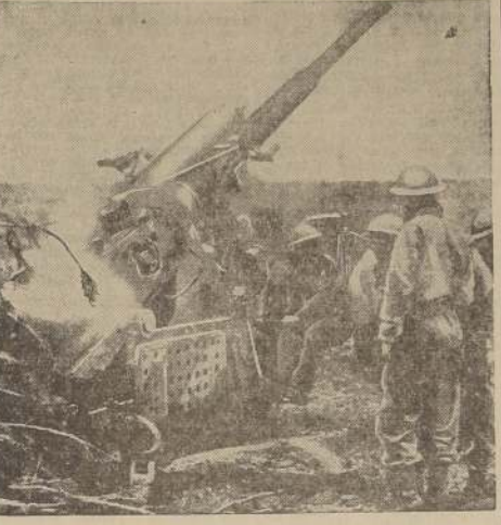
Los artilleros británicos de las baterías antiaéreas tienen ahora una nueva tarea con sus cañones de 3.7 pulgadas. Además de dar protección aérea, se les usa como artillería de campaña. Este cañón tuvo un importante papel en la defensa de Cardiff y Hull durante la Batalla de Gran Bretaña. — Aquí vemos uno de estos cañones en acción en el frente del Octavo Ejército.

Stalin dispone que se dispersen 20 salvas de 224 cañones y rinde homenaje a la infantería al mando de la batalla.