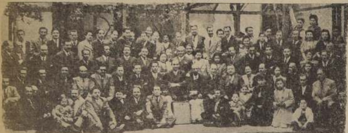
Aspecto de los asistentes a los actos aniversario de la Unión de Peluqueros.

CESION SOLEMNE Y BANQUETE EN SU SEDE SOCIAL.—HOMENAJE RENDIDO A SUS DIRIGENTES