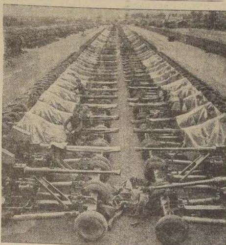
Largas filas de cañones antiaéreos de 40 mm., ahora sirviendo para las fuerzas aliadas en el frente francés.

LONDRES, 15. (U. P.). — Los bombarderos pesados aliados atacaron la zona de retaguardia de la línea Siegfried, bombardearon hoy Colonia y las ciudades de Düsseldorf y Duisburg, en el curso de la imparable ofensiva aérea que comenzó el día 14. Los aliados lanzaron más de 1.200 aviones, y bombardearon por completo el mapa del puerto fluvial de Duisburg.