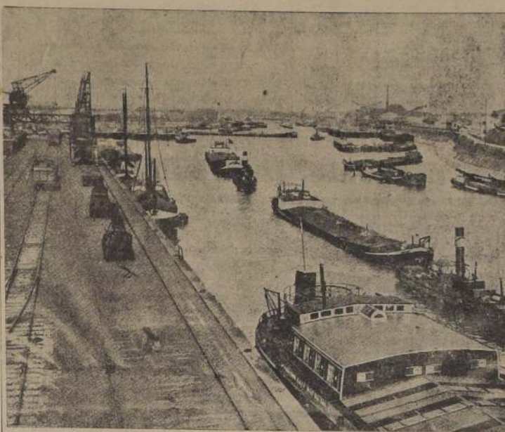
El puerto de Duisburg (situado en el Rhin cerca de la confluencia con el río Ruhr), que se encuentra parcialmente inundado.