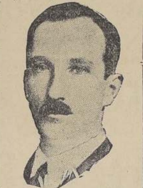
S. M. Boris III

En un principio surgieron dificultades de carácter religioso, debido a que Boris pertenece a la Iglesia Ortodoxa; pero éstas fueron subsanadas finalmente. No se sabe si la Princesa Giovanna abjurará de la Iglesia Romana.—(U. P.)