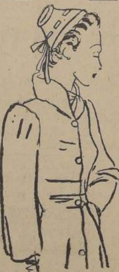
Modelo de terciopelo azul "Royal", ceñido al talle y abrochado con botones de metal patinado