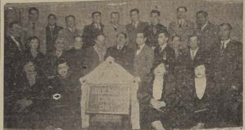
Grupo de los asistentes a la manifestación de ayer en el Sindicato Circense de Chile, con motivo de la inauguración oficial de la placa de la institución.