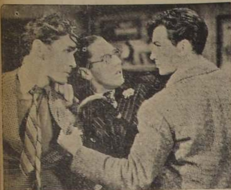
Una escena del estreno de hoy en el Teatro Metro, nueva producción Metro-Goldwyn-Mayer.

En las funciones de hoy, mañana, miércoles y noche, a las 8 P. M., 6.30 y 10 P. M., respectivamente, el Teatro Metro estrenará la producción cinematográfica, "Un yankee en Oxford". Como su mismo título lo indica, se trata de la aventura de un muchacho americano que trata de transformar las costumbres centenarias de esta célebre ciudad inglesa.