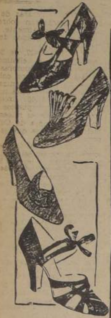
Caprichosas formas en los zapatos

Cuatro modelos de zapatos con adornos combinados son estos que mostramos. El primero es de cabrito color sangre de toro, con bordes de un azul claro. A la izquierda un moño sobre el empeine. Al anterior sigue otro de cabrito marrón rojizo con bordes dorados que adornan la lengua cortada de secciones. Los dos que restan son: el primero, de cabrito color herrumbre con bordes dorados, que lleva a un costado un adorno asimétrico. El último, de cabrito color azul oscuro, de corte original, tiene bordes azul claro, y a la izquierda un moño de cinta.