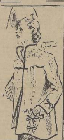
Confortable es esta chaquetilla de Persia con "garniture" de lana