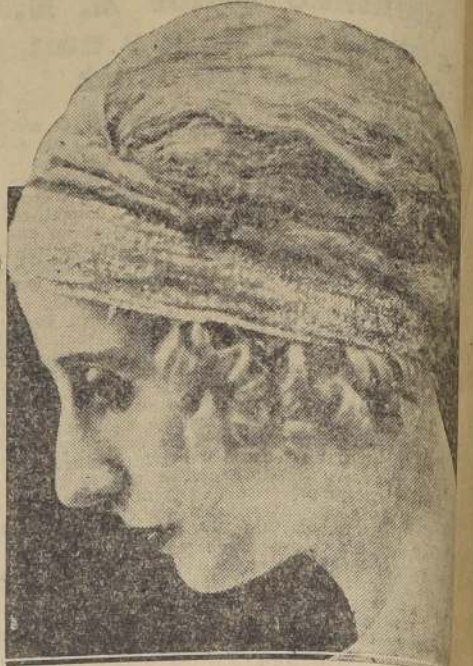
Ana Pavlowa, la más grande bailarina de los últimos pos, cuyo genio coreográfico se perpetuará a las generaciones venideras mediante un monumento que se levanta a su memoria en el Regent's Park de Londres.