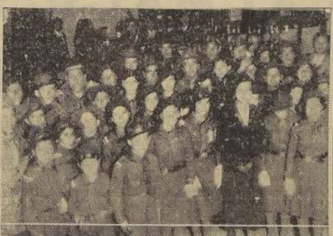
La delegación de Maule en nuestra casa

Ayer a las 19 horas, las Brigadas de la provincia de Maule que asisten a la Concentración Nacional con motivo del 25º aniversario de la institución de los Boy Scouts de Chile, hicieron una visita a la "La Nación".