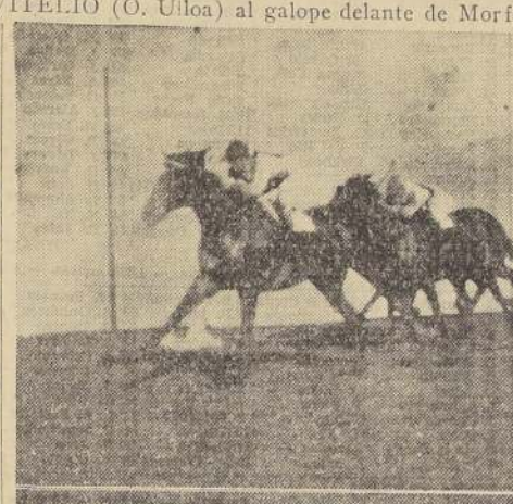
Pedante, aventaja a Nicaragua y Caramanchel

Segunda carrera La prueba para ponederos no