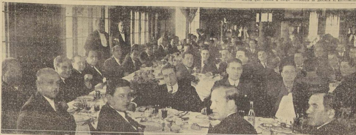
Asistentes al muerzo en el Club Hípico, ofrecido por los organizadores de la Jornada Sanitaria a los médicos que vinieron de provincias.

En la siguiente parte, se pasaron varias películas descriptivas y cómicas que cedió gentilmente el Liceo para esta ocasión la Compañía Warner Bros.