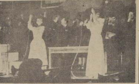
Irando las banderas de las Naciones Unidas