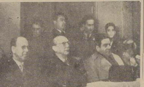
Otras personalidades asistentes