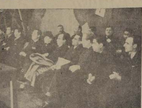
La presidencia del acto de ayer