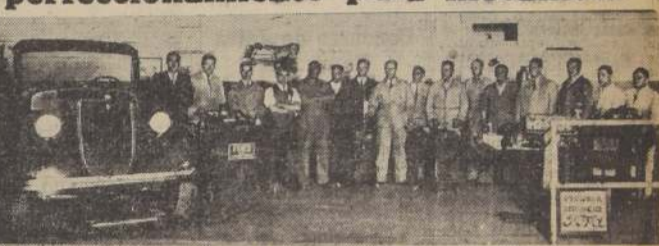
La fotografía muestra un "Curso de Servicio" de la sucursal de la Ford Motor Company en Santiago.

des, que periódicamente vienen a la sucursal Ford a entrenarse en los últimos adelantos en maquinarias, equipos de taller, reparaciones, etc. de los coches Ford.