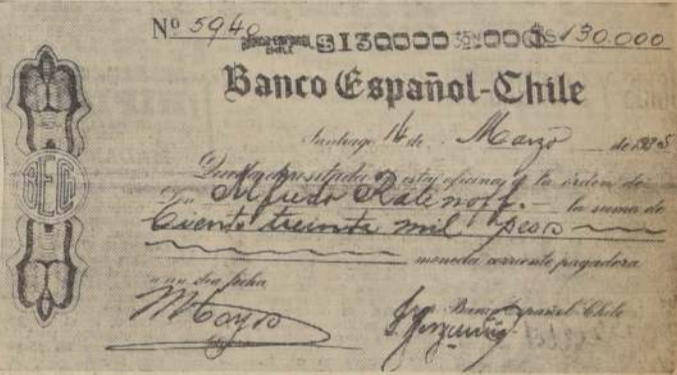
Facsimil del vale vista del Banco Español, en que se acredita la negociación

Ciento treinta mil pesos recibió el promotor por la taquilla. — Una sociedad, formada especialmente, se hizo cargo del gran espectáculo