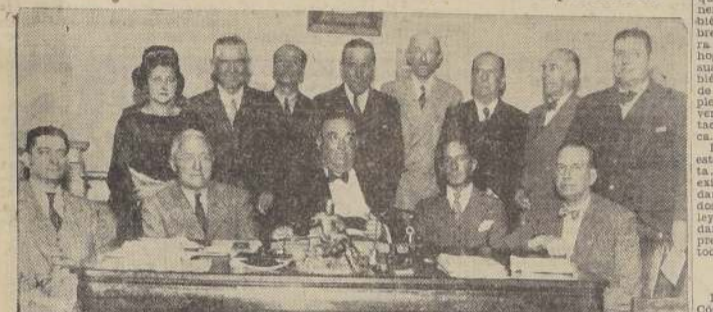
Miembros del Directorio, y mesa que efectuó el escrutinio en la elección en el Círculo "Piloto Pardo".

Llevará a bordo un curso de futuros oficiales de la Marina Comercial. — También una exposición de productos y una misión periodística.