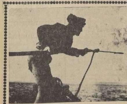
ESTRENO EXCLUSIVO EN EL BARRIO SAN DIEGO, DE LA MONTAÑAL PRODUCCION INGLESA, "SELECCION DIARIA Y CIA." (Mayores y menores).

Novedad será escuchar la música del folklore centroamericano. La Marimba Curcantián se presentará en las dos funciones del miércoles próximo en La Comedia ofreciendo interesantes conciertos.