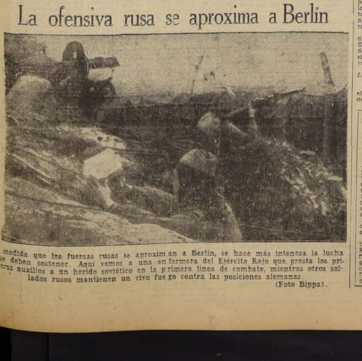
La ofensiva rusa se aproxima a Berlín