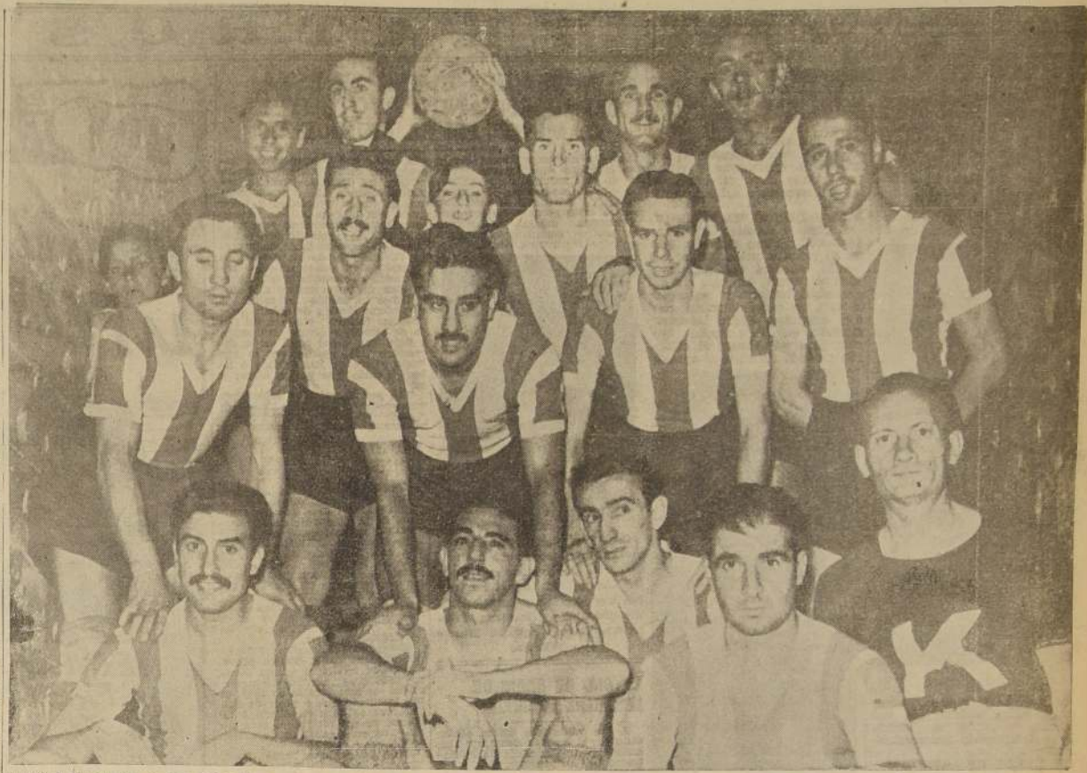
LISTOS PARA EL GRAN MATCH. — No importa que Uruguay, en estos momentos, no tenga chances al primer puesto del Campeonato, y que Argentina sea uno de los posibles vencedores. Lo que importa es que este match es el "clásico" del fútbol sudamericano. Se trata de dos rivales tradicionales y que siempre llegan a una cancha sin saber a quien correspondará el triunfo, por muchos y muy definitivos que sean los antecedentes. Es lo que puede ocurrir en el encuentro del domingo. Aquí vemos a los argentinos, después de ganar al Brasil. Están más optimistas que nunca y dispuestos a ofrecer una gran exhibición.