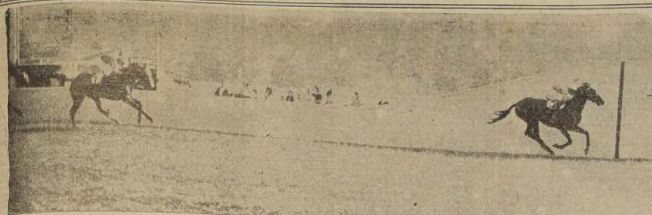
El amplio margen porque se impuso Barranco sobre sus coetáneos en los 3.000 metros del clásico "Saint Leger", y el empuje con que terminó su recorrido, confirmaron plena mente nuestras apreciaciones vertidas a raíz de su derrota en "El Derby". A cinco cuerpos finaliza Abarquero, delante de Amontillado y Bufón