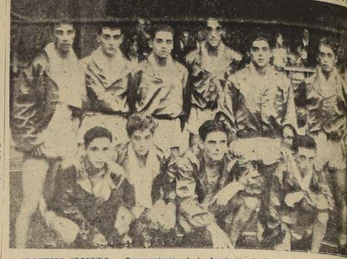
SE CLASIFICÓ SEGUNDO. — Representación de la Asociación de Temuco que anoche fue vencida por Santiago por 42-21, en un match en que quedó claramente demostrada la superioridad de los metropolitanos. Quedó clasificado el tercero, Iquique, y cuarto, Osorno.