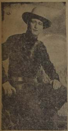
RONDA DE SANGRE, drama de gran acción, con el popu- lar John Wayne, Ray Corrigan y Carole Landis, estrenará el viernes el rotativo REX.