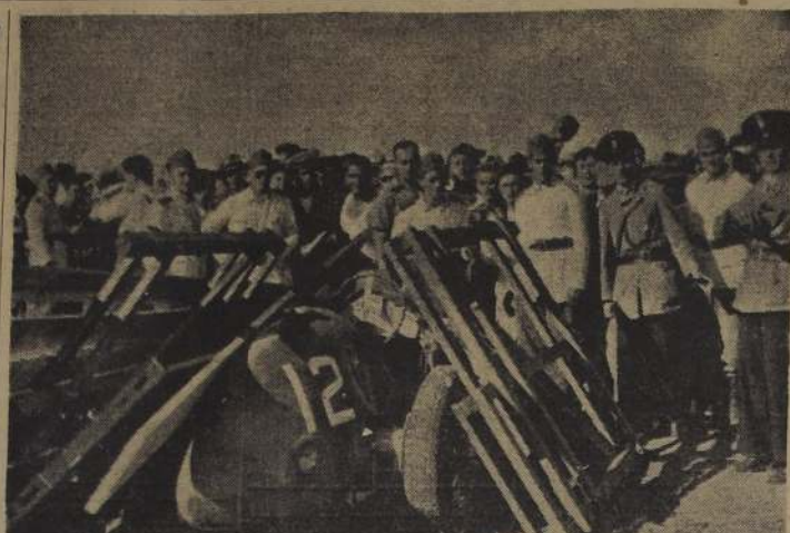
FARISA MATA A 9 PERSONAS Y HIERE A 23, EN CARRERA DE AUTOS EN BUENOS AIRES. — BUENOS AIRES. — Estado en que quedó el coche del piloto italiano Giuseppe Farina, después del accidente que tuvo al precipitarse sobre el público, que prácticamente había invadido una curva peligrosa, y matando a 9 personas, 23 quedaron heridas graves. Un cordón de soldados y policías impide que los curiosos se acerquen al lugar que se encuentra en una de las vallas. Farina resultó ileso.