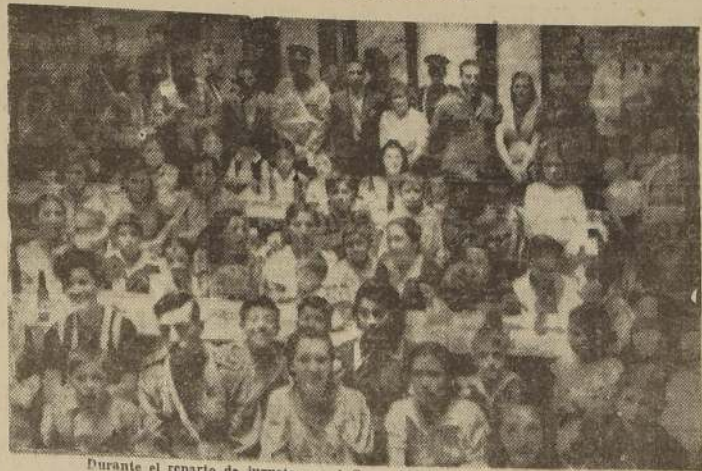
Durante el reparto de juguetes en el Grupo Móvil de la Prefectura del Tránsito

En diversos sitios públicos y en numerosas instituciones sociales, se repartieron juguetes a los niños pobres. En la Quinta Normal se llevó a cabo un gran programa de repartición de juguetes, organizado por la Municipalidad de Santiago. La celebración de la fiesta de Navidad en la Asamblea Radical, en el Bando de Piedad de Chile y en otras diversas instituciones