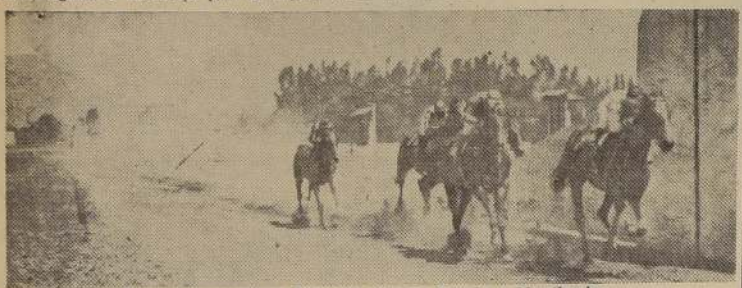
Carotte aventaja a Belcebú, Goody Goody y Novilunio.

Condesa, mientras tercera, a igual distancia, actuaba Armonia, delante de Cereñonosa y Leica, cerrando el paso Urraca.