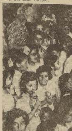
Durante el reparto de juguetes en la Asamblea Radical

llamados a despertar en los niños el interés por una Compañía nacionalmente chilena, que lucha esforzadamente por rendir el máximo en beneficio de la nación, y que es la única que lleva el pabellón nacional hacia los puertos de Estados Unidos y del Mar Caribe.