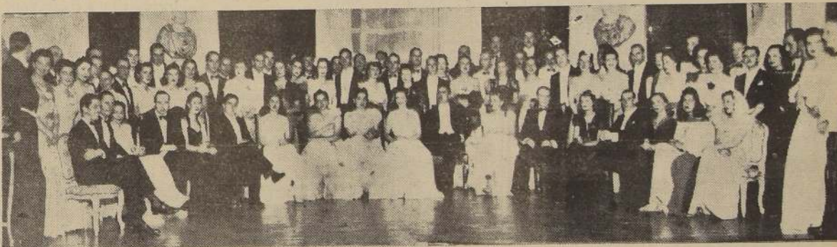
Asistentes a la comida ofrecida en honor de los hijos del Embajador de Colombia, en el Hotel Carrera.