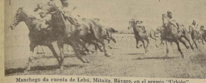
Manchego da cuenta de Lebú, Mitaita, Bávaro, en el premio "Urbión".

El desarrollo de las distintas competencias. PRIMERA CARRERA Se dio comienzo a la reunión con el premio Uly, condicionado sobre 1.000 metros, para caballos de 4 años y más, y en donde Campesina se impuso al galope sobre Canillita y Natividad, repartiendo $ 76.20 por cada cinco. Ordenada la salida, Campesina se puso al frente y rápidamente se cortó un cuerpo sobre Trajectory, escalándose a continuación, Acoulin, Canillita, Stop Gap, Natividad, Monopolio y los restantes con La Fontaine al fondo. En la forma apuntada se desarrolló la carrera hasta la entrada de la tierra derecha, en donde Campesina se adelantó, dando paso a Acoulin, al tiempo que se hacían presentes Natividad y Monopolio. Al volcar el codo, Belveder se adelantó por el lado izquierdo, lo que le permitió aparecer en la recta con apreciable claridad sobre los demás.