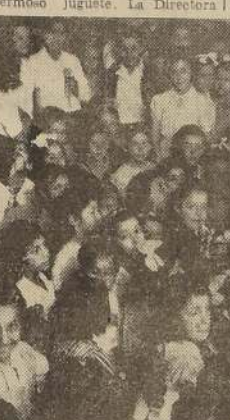
Durante el reparto de juguetes en la Asamblea Radical