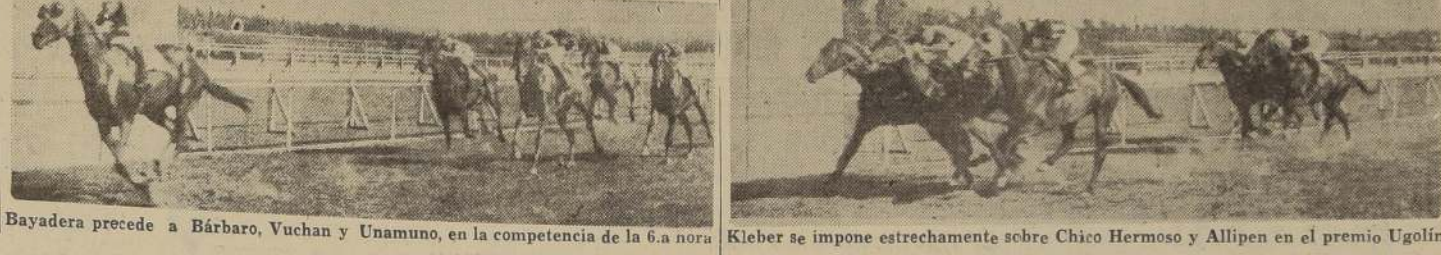
Bayadera precede a Bárbaro, Vuchan y Unamuno, en la competencia de la 6.ª noche