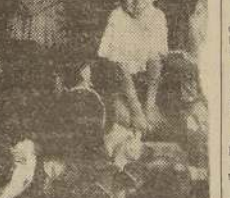
Durante el reparto de juguetes en la Asamblea Radical

La base principal de este envío posterior del Comité lo forman los juguetes de madera que obsequiaron los chilenos que se encontraban en Estados Unidos durante la Navidad de 1940.