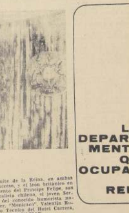
La Reina Isabel II y el Duque de Edimburgo, en su visita oficial a Chile.

Las autoridades oficiales de la Reina Isabel II en Chile, han anunciado que la Reina y el Duque de Edimburgo, estarán en Chile durante su visita oficial.