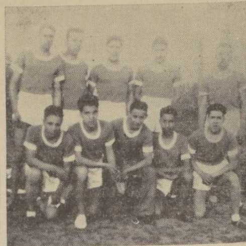
La delegación atlética del Comercio, que obtuvo un merecido triunfo en el torneo de Buin

La Sección Atlética del Comercio ha preparado para el certamen oficial programado para el próximo domingo un equipo que se espera sea un peligroso rival de los pretendientes al 1.º puesto del cómputo final. Es así como la siguiente es la nómina de la delegación que re-