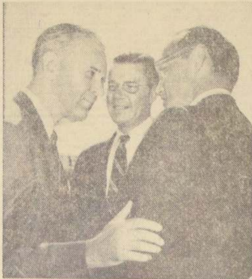
WASHINGTON.— El ex Embajador de Estados Unidos en Saigón, Maxwell Taylor (izquierda), es recibido en el aeropuerto a su regreso al país ayer 3, por el Secretario de Defensa, Robert McNamara (centro), y el asistente presidencial McGeorge Bundy.

"Los cañones deberán enmudecer, la agresión de los Estados Unidos en Vietnam deberá terminar, a menos que haya algún progreso en nuestra tarea", expresó Tsarapkin en la conferencia... En su virulento discurso Tsarapkin también atacó a los planes occidentales para la creación de una fuerza dentro de la Organización del Tratado del Atlántico Norte (OTAN).