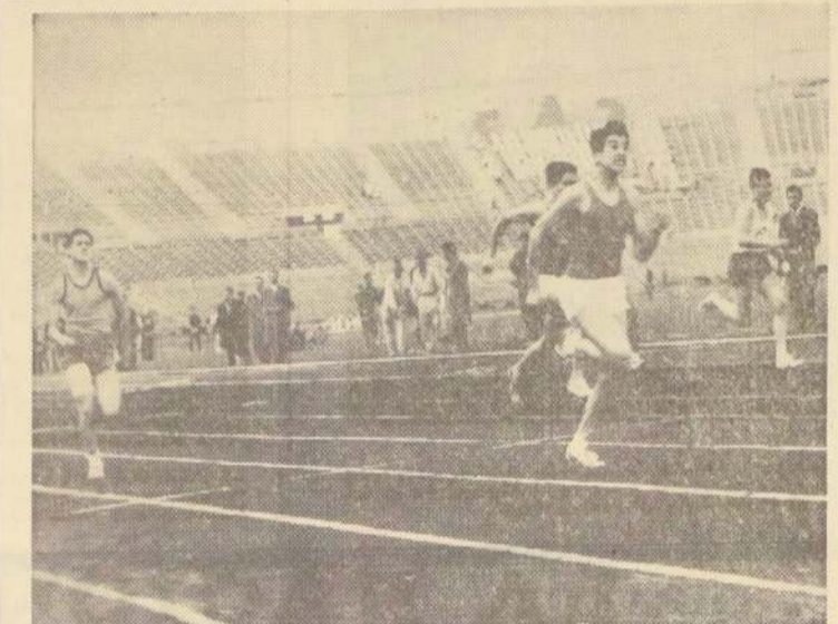
ESCENAS COMO ESTA, en que se ven muchachos de colegios corriendo con esfuerzo tras el triunfo para sus colores y con las tribunas del Estadio Nacional ocupadas por barras organizadas, se repetirán durante este fin de semana con la realización del 32.º Campeonato Intercolegial Masculino, que organiza el Atlético Santiago.