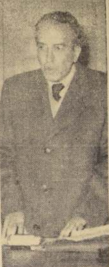
Don Alberto Baltra Cortés, presidente del Radicalismo, en los momentos en que rinde su cuenta política ante el Consejo Nacional de su Partido, reunido ayer.

Parte de la proposición soviética ha sido ya presentada bajo otras formas. Pero los observadores diplomáticos de la capital soviética dicen que el actual proyecto ruso equivale a un tratado que acabaría con el "telón de hierro".