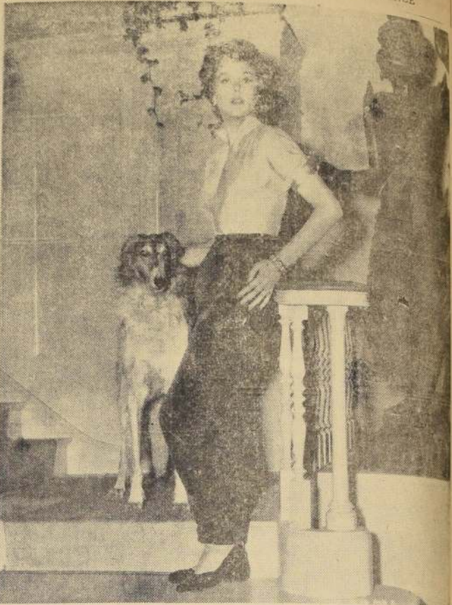
KAY KENDALL, hermosa actriz británica que veremos en la humorística comedia inglesa "Marido Constante", donde comparte honores con su marido, Rex Harrison.

Yo transmitía el mensaje, y el gran hombre me miraba con una sonrisa socarrona. Por fin aparecía en el comedor... a las dos en punto.