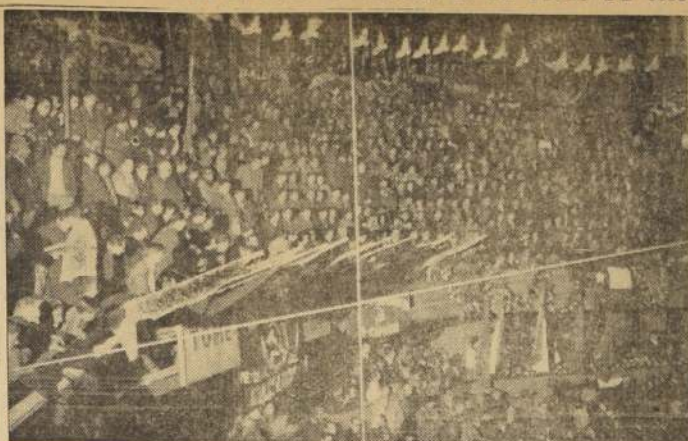
CONCENTRACION COMUNISTA.— Vista parcial de las asistentes a la concentración pública realizada ayer, en el Teatro Municipal, por el Partido Comunista, con el objeto de exteriorizar sus anhelos de derogación de la Ley de Defensa de la Democracia, que le privó de vida legal, hace diez años. Oportunidad fue esta en que se rindió homenaje al presidente y al secretario general de la entidad, Sres. Elias Laferte y Luis Corbalán, respectivamente. El discurso de fondo estuvo a cargo del Sr. Cesar Godoy Urrutia, en representación del Comité Central.

pronunciado por el señor Cesar Godoy Urrutia, en representación del Comité Central comunista. "Durante diez años, desde la pérdida trágica, no ha habido fuerza humana o divina capaz de apartarnos del pueblo. Somos una gran familia, un mundo en el que la conciencia es la única que importa. La conciencia es la única que importa. La conciencia es la única que importa."