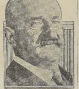
Conde de Romanones

La discusión duró tres horas. La última parte de ella se basó en el contenido de una nota que yo había preparado y que fue finalmente