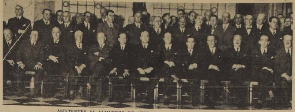
ASISTENTES AL ALMUERZO DE AYER EN EL CLUB DE LA UNIÓN.