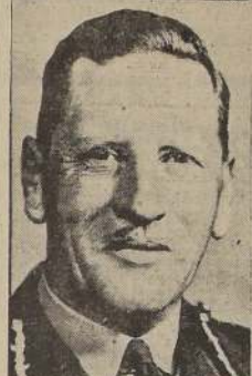
General Claude Auchinleck, comandante en jefe de las fuerzas inglesas que operan en Libia

El comunicado de hoy, que continúa una extensa exposición de la ofensiva del enemigo demuestra claramente que los británicos, a fin de contener la acometida del Eje, en primer lugar, y anular las ventajas lograda por Rommel en su primer impulso, atacaron en forma furiosa, repetida y resueltamente, las líneas de abastecimiento de aquél. De este modo convulsionaron a las huestes de Rommel cuando ya se hallaban próximas a su objetivo, Tobruk. Fue esa acción británica, la que privó al jefe alemán de los medios para continuar la lucha y la que le obligó a intentar desesperadamente el repliegue de sus fuerzas blindadas de nuevo a través de los caminos minados, pero en dirección al oeste.