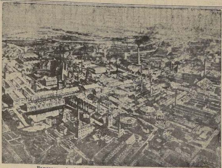
Panorama de las fábricas de armas, Krupp, en Essen

Desde la tarde del 25 hasta el 30 de mayo se lanzaron contra el convoy fuertes ataques aéreos a cargo de bombarderos comunes, bombarderos en picado.