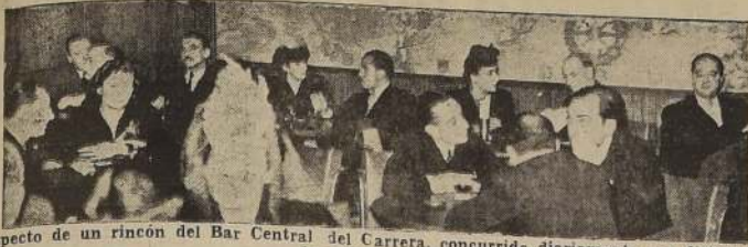
Aspecto de un rincón del Bar Central del Carrera, concurrido diariamente por distinguidas familias.