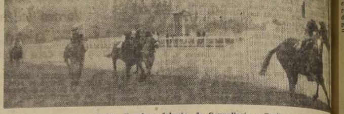
Vodka al galope delante de Convallaria y Pretencioso

Tridente demoró la largada con sus indolencias y terminó por mover mal, en justo castigo, mientras Gil Robles se posesionaba del extremo delantero, pero, levantado luego por su jinete dejó pasar a Pretencioso, que se cortó un cuerpo sobre Vodka, quedando tercera Convallaria y luego Gil Robles, con tridente en último término. Los bríos le duraron a Pretencioso hasta la altura de las galerías, en donde Vodka se le puso al lado, se desprendió de él para terminar el recorrido