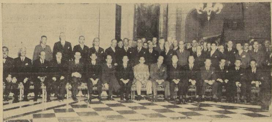
Asistentes al almuerzo ofrecido ayer en el Club de la Unión al Agregado Comercial de la Embajada de los Estados Unidos de América con motivo de su alejamiento de Chile.