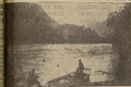
Río Yelcho cerca de la desembocadura, lado sur

En el terreno hay cuatro comisiones — comienza por decir el señor Maigé. — La primera, está destinada a la parcelación de todo el curso superior del río Yelcho, denominado también río Futaleufú, donde hay alrededor de 120 familias chilenas emigradas de Argentina, que han ido colocándose a medida de las circunstancias. Parte de la región indicada está ya parcelada y algunas familias ubicadas. La tercera subcomisión está ocupada en estudiar el curso medio del valle del Yelcho, donde existen grandes propiedades, particulares, de cuya situación se informará previamente al Consejo de la Caja para resolver sobre su adquisición. En este valle el Gobierno proyecta la ejecución de un camino internacional que unirá al puerto de