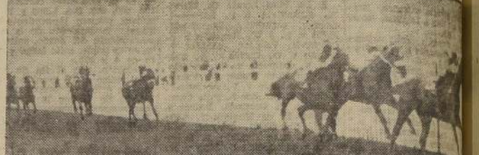
Santidad bate a Furgón y Pompoón en el clásico "Cuerpo de Bomberos"

al galope con dos y medio cuerpos sobre Convallaria a 34 de cuerpo de la cual terminó tercero Pretencioso delante de Gil Robles. Último, Tridente.