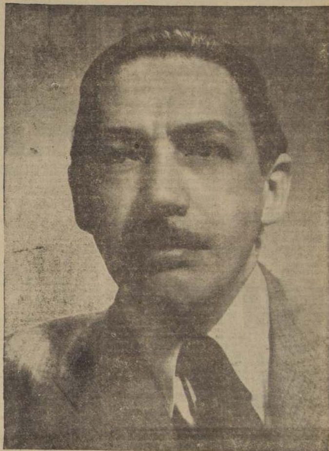
"El 28 de noviembre el país dará la medida de lo que puede, de lo que necesita y de sus posibilidades de progreso". (Oscar Schnake)

En el intervalo han sucedido fenómenos sociales, económicos y políticos que han ido respondiendo a las necesidades de la masa, que han forzado a veces