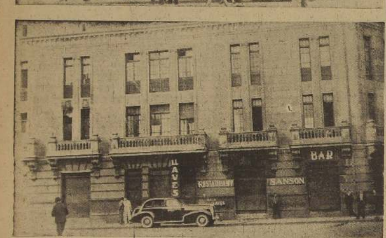
I y II.— Estos negocios clausurados, representan la cesantía para muchos empleados y la miseria en sus hogares

Un grupo numeroso de dueños de Bares y Restaurantes, afectados con el cierre de sus negocios, por disposición municipal, en virtud de haber sido puestos en ejecución las disposiciones de la Ley N.º 6.179, nos ha dicho lo siguiente: Queremos hacer pública nuestra protesta por la parcialidad manifestada con que se está dando cumplimiento a las disposiciones de la Ley de Alcoholes, puesta recientemente en vigencia. Mientras a los comerciantes que tenemos establecidos, nuestros negocios en las inmediaciones del Mercado Central, y a menos de cien metros del mismo, se nos ha ordenado repentinamente cerrarlos, en el interior del Mercado se permite el funcionamiento de establecimientos de la misma índole, que venden licor, sin control alguno y a toda hora. Esta irritante parcialidad, nos resulta verdaderamente insoportable.