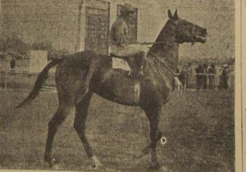
MAC MAHON, que cuenta con grandes partidarios para la "Copa Jackson"

tentan training sobresalientes, se encargarán de emplear a fondo al pupilo del Coronach y de los otros integrantes del selecto grupo, aportan a su vez novedad, Flamiel, que reaparece en gran