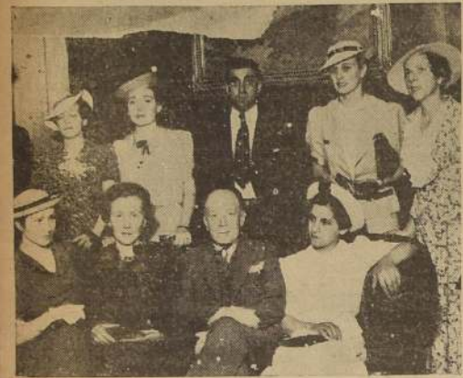
La delegación de profesoras de Mendoza con el Director de "LA NACION"

Asistirá a los Cursos de Verano de la Universidad de Chile, que serán inaugurados el próximo domingo