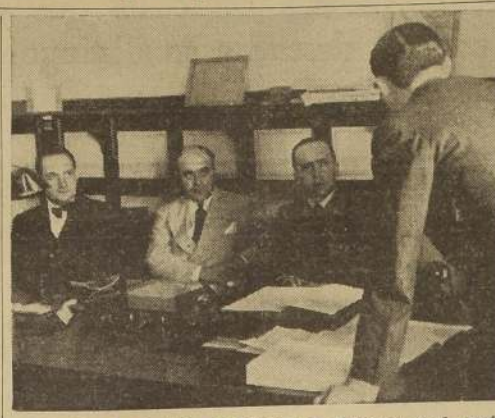
El Ministro de Justicia, el Director de Prisiones y el presidente del Instituto de Ciencias Penales durante el acto de inauguración

El Instituto se fundó el 29 de diciembre de 1936, bajo los auspicios de la Dirección General de Prisiones. El objeto de dicho organismo es tratar de conseguir por todos los medios científicos posibles, la readaptación del delincuente para que