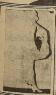
ESTRENO DEL 'LA PRIMERA del 38'