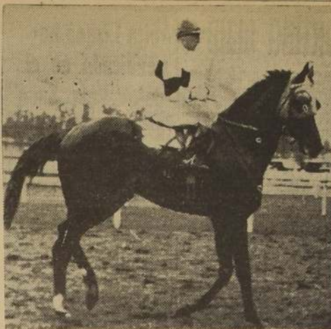
CENTURION, que se perfila como favorito para el Premio "Jockey Club Argentino"