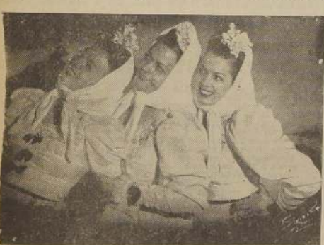
El famoso TRIO MORENO.

¡EL MEJOR "SHOW" DE SANTIAGO! — ¡GRACIA Y SIMPATIA!