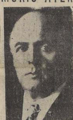
Dr. Gabriel Terra, ex Presidente de Uruguay.

MONTEVIDEO, 15. — (U. P.) — Después de una larga enfermedad, el ex Presidente de la República, don Gabriel Terra, falleció hoy a las 7.30 P. M.