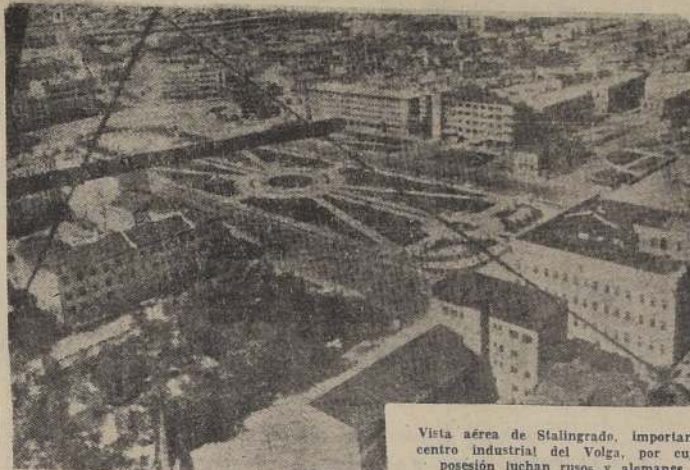
Vista aérea de Stalingrado, importante centro industrial del Volga, por cuya posesión luchan rusos y alemanes.