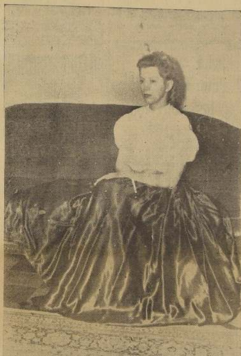
Señora de Trueblood, esposa del Encargado de Negocios de Estados Unidos.

Instituto de Belleza LARENAS MONEDA 816. Fono 89665.