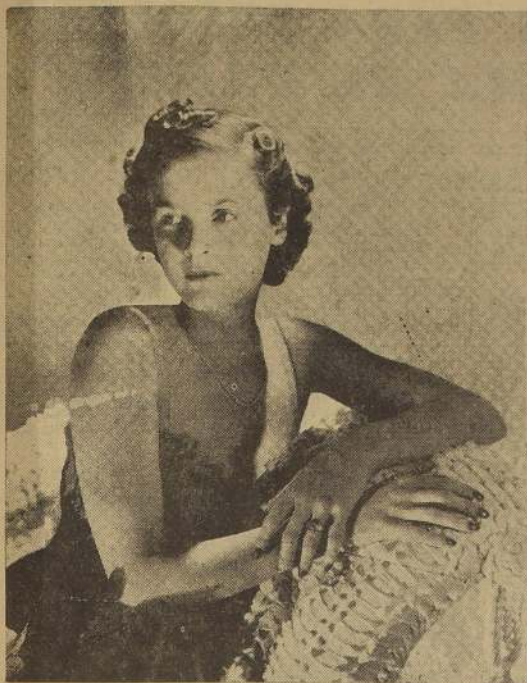
Mrs. Franklin D. Roosevelt, Jr.