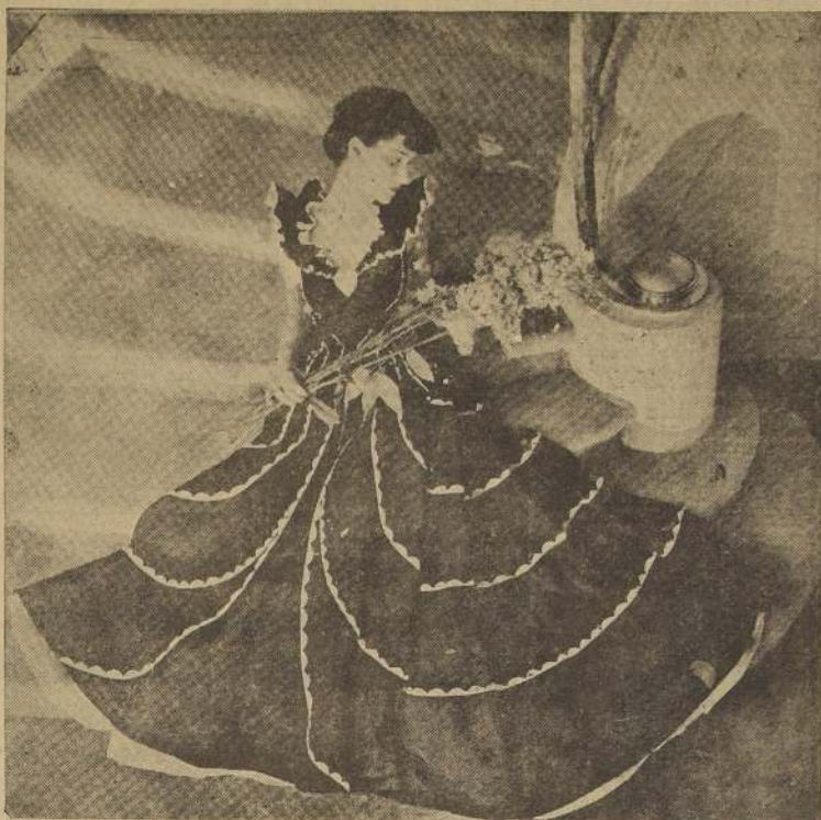
Original y elegante este modelo para la noche, adecuado tanto para una jovencita como para una señora. En moaré negro bordado de ondas en piqué de seda blanco hará un efecto muy novedoso y seductor.

La ondulación al agua ha sido sencillamente una consecuencia de la ondulación permanente, o sea, que únicamente data su actual desarrollo a partir del año 1905, que fue, como hemos indicado, un principio por ondulación al agua (water wave) porque se marcaban las ondas con peinetas únicamente sobre el cabello mojado; y el (Finger wa-