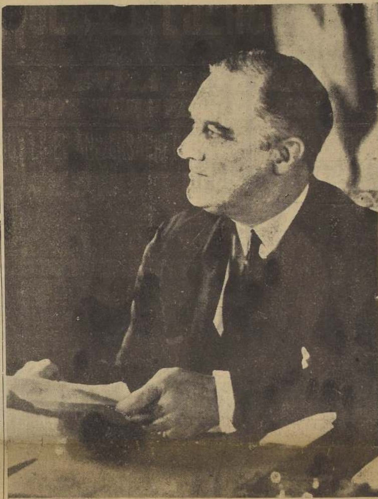
Mr. Franklin D. Roosevelt, Presidente de los Estados Unidos de Norte América, que celebra hoy el día de su Independencia.

HOY ES EL ANIVERSARIO PATRIO DE ESTADOS UNIDOS