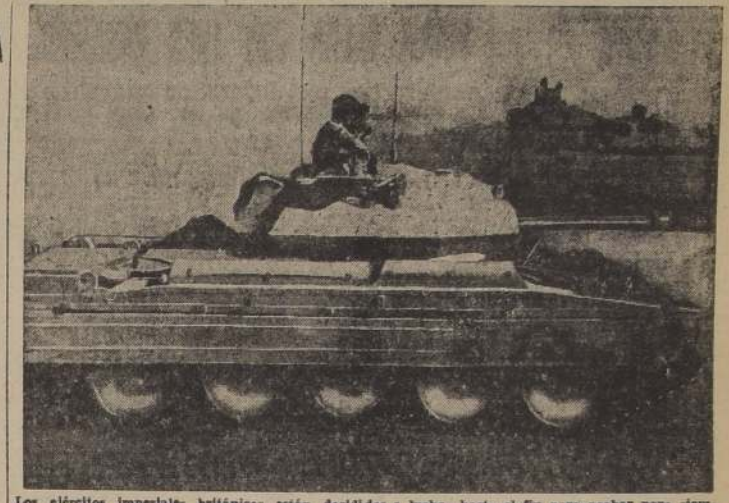
Los ejércitos imperiales británicos están decididos a luchar hasta el fin para acabar para siempre con la tiranía totalitaria. Estos tanques "Crusaders" están en servicio en los ejércitos imperiales británicos.