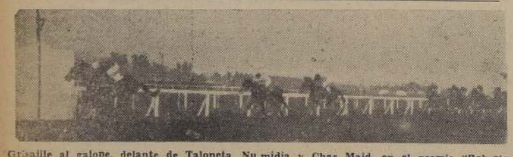
Grisaille al galope, delante de Taloneta, Numidia y Char Maid, en el premio "Roberto Vial Souper".

Frente a las galerías, Tartanera y Chinelas se desprendieron de Posesión y tete a tete siguieron al disco en donde Chinelas logró me-