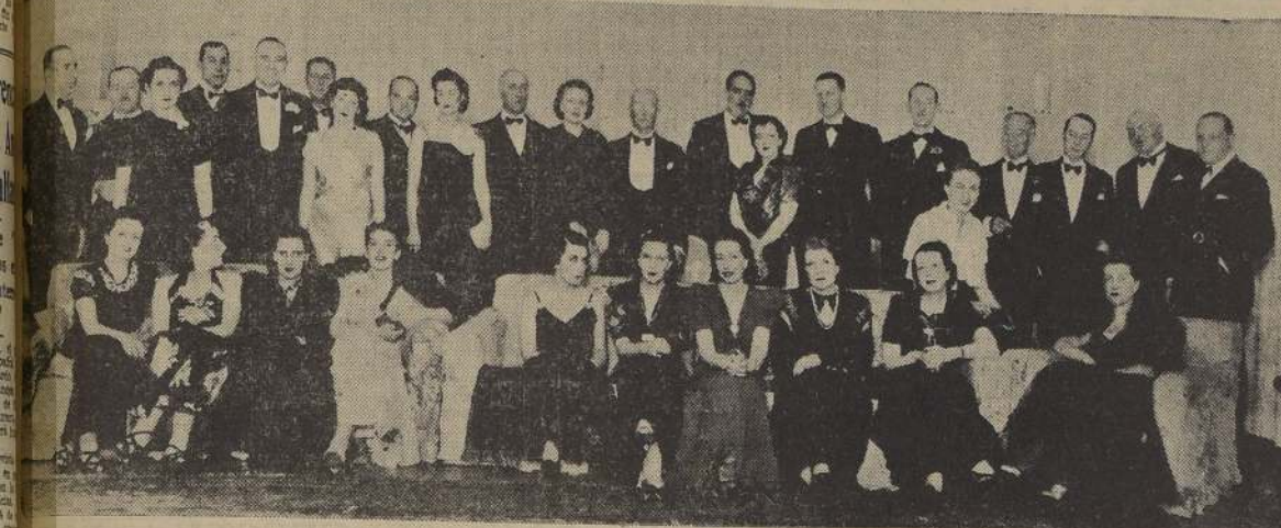
Parte de los asistentes a la manifestación ofrecida anoche por el Directorio del Club de Golf, en el local de la institución, a dirigentes de la Sociedad Nacional de Agricultura y delegados a la gran Exposición de la Quinta Normal.