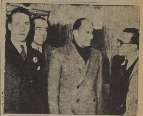
El Ministro de Industria del Uruguay, don Gerardo de Posada Belgrano, a su llegada a esta capital.

Lo acompañó el Ministro del Uruguay, Excmo. señor Carlos de Santiago. — Invitado a la Exposición de Animales