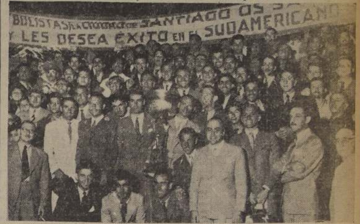
Los futbolistas argentinos a su llegada a Santiago

"Los peruanos deben hacer un lucido papel", nos dijeron los jefes de la delegación de Argentina. — Pedirán como refuerzos a Masantonio, Pedernera y Colombo. — Sus impresiones