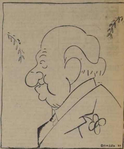
El internacionalista chileno don Alejandro Alvarez, que al regresar al país ha recibido el homenaje merecido por su labor mundialmente reconocida