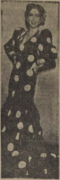
MARIA ANTINEA, la gran estrella del arte español