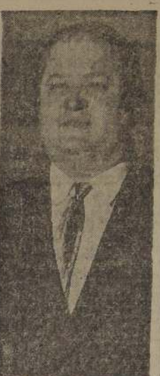
CANTA HOY EN EL MUNICIPAL.

El aplaudido tenor cosaco Nikolay Timofeyev, ofrece esta noche un concierto en el Teatro Municipal. Acompañado por la pianista Adelina Puccini, interpretará romanzas de ópera y escudillas con posiciones del folklore internacional.