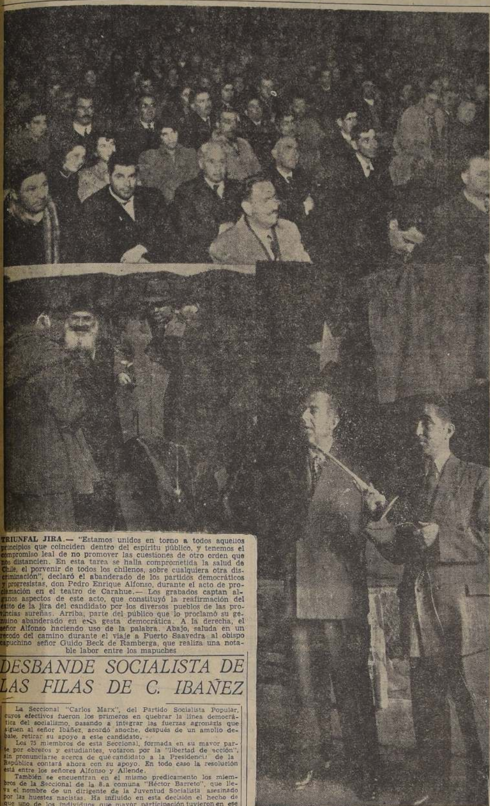
TRIUNFO JIRA. — "Estamos unidos en torno a todos aquellos principios que coinciden dentro del espíritu público, y tenemos el compromiso leal de no promover las cuestiones de otro orden que las distancien. En esta tarea se halla comprometida la salud de Chile, el porvenir de todos los chilenos, sobre cualquiera otra discriminación", declaró el abanderado de los partidos democráticos y progresistas, don Pedro Enrique Alfonso, durante el acto de proclamación en el teatro de Carahue. — Los grabados captan algunos aspectos de este acto, que constituyó la reafirmación del éxito de la jira del candidato por los diversos pueblos de las provincias sureñas. Arriba, parte del público que lo proclamó su genuino abanderado en esta gesta democrática. A la derecha, el señor Alfonso haciendo uso de la palabra. Abajo, saludando en un momento del camino durante el viaje a Puerto Saavedra al obispo capuchino señor Guido Beck de Ramberg, que realiza una notable labor entre los mapuches.