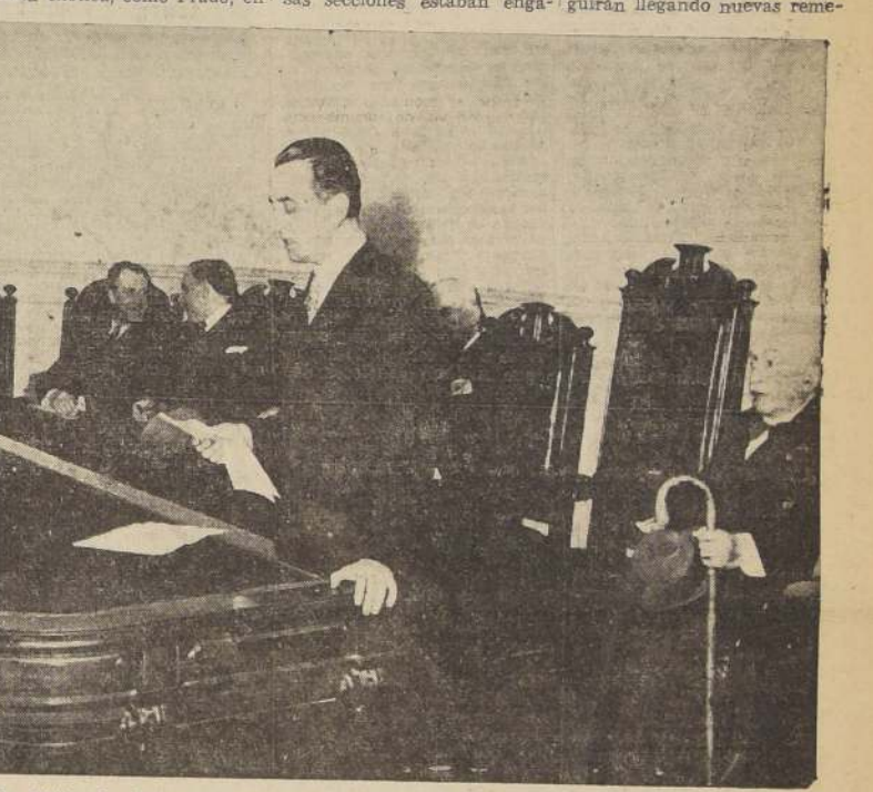
El Rector de la Universidad de Chile, da lectura a su discurso durante la inauguración de la Exposición del Libro Americano y Español