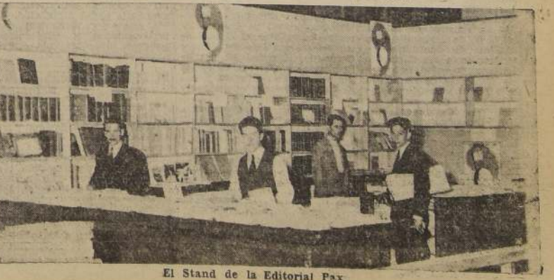
El Stand de la Editorial Pax

Los coros están a cargo del Liceo de Niñas de San Bernardo conjunto premiado en el concurso que recientemente organizó el Departamento de Extensión Cultural de la Universidad.