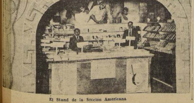
El Stand de la Sección Americana