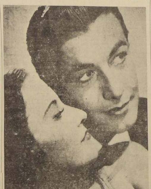
Robert Taylor, el galán de moda, y Barbara Stanwick, protagonistas de "La Esposa de su Hermano", que estrena mañana el Teatro Metro.

En las tres funciones de mañana, en el Teatro Metro, mañana, miércoles y noche respectivamente, se estrenará en Chile la gran producción Metro-Goldwyn Mayer, "La Esposa de su Hermano", producción que protagonizan Robert Taylor y Barbara Stanwick. Este estreno ha sido esperado por nuestro público amante del buen cine, no solo por encontrarse protagonizado por Robert Taylor (hoy por hoy el actor de mayor atracción), sino también por tratarse de una obra que ha sido realizada por W. S. Van Dyke, el autor-director de Oh, Marietta, Rose Marie y San Francisco, quizá las tres películas que mayor éxito han obtenido en los últimos años. "La esposa de su hermano", es un fuerte drama pasional, drama que encierra el sugestivo tema de una mujer enamorada del hermano de su propio esposo. Este extraño trágico, lleva a un desarrollo hondamente dramático que permite a la gran actriz Barbara Stanwick una de sus mejores labores escénicas. El lujo, la elegancia de sus intérpretes, la visión de escogidos paisajes y también la delicadeza de los diálogos, hacen de esta obra a pesar de su tema fuerte, una filigrana de delicadeza. "La esposa de su hermano", como lo anunciamos es el estreno que ofrece para mañana, en sus tres funciones el Teatro Metro.