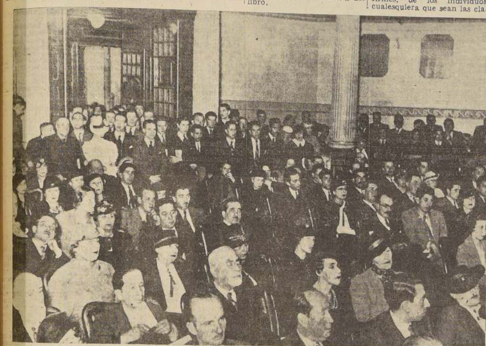
Un aspecto de la numerosa concurrencia que asistió ayer a la velada inaugural de la Exposición del Libro Americano y Español en el Salón de Honor de la Universidad

Ante un público numerosísimo, que llenaba por completo las diversas aposentadas del salón central de la Universidad, se dio comienzo a la velada inaugural de la Exposición del Libro Americano y Español, con un número de violín a cargo del