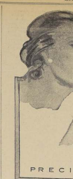
PRECIO $ 1.20 LA CAJETILLA