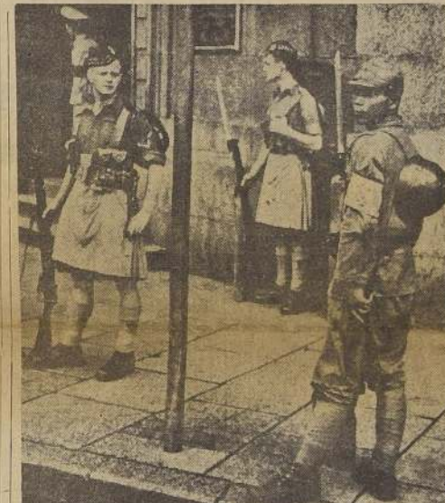
FRENTE A FRENTE.—Dos diminutos y jóvenes escoceses y un japonés, sorprendidos por el fotógrafo en una calle de la concesión internacional de Tien-tsin

Se informa desde Angora que el Gobierno turco ha re- querido el sábado, el sábado, el líder local Albert Foerster, dijo: "No queremos la guerra. El Führer y Mussolini hacen todo lo posible por mantener la paz. Queremos nuestros derechos y nada más. Estamos en Danzig como alema- nes y queremos volver a la madre patria. Nos preparamos para to- das las eventualidades. Nuestra unidad debe robustecerse más aún."