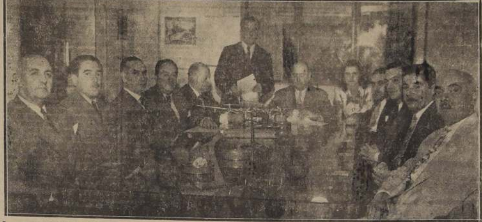
Los representantes de la Línea Aérea Nacional y de la Flota Aérea Mercante Argentina, que firmaron el convenio

EL TRAFICO AEREO COMERCIAL ENTRE SANTIAGO Y BUENOS AIRES SERA ATENDIDO POR AVIONES CHILENOS Y ARGENTINOS. — COMIDA EN EL HOTEL CARRERA