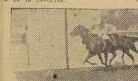
L'Ermitage triunfa sobre Lamparón, Boyhood y La Limeña.

Los camiones corrían a un tren muy sostenido, y el público aplaudió esta pasada. Sin variantes se desarrolló la prueba, hasta la recta de los mil cien metros, en donde Caloría acortó la distancia que la llevaba el "leader", y La Cuarta y Tantehue se aproximaron rápidamente hasta muy cerca de la favorita.