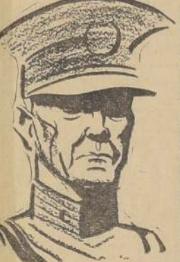
El Comandante en Jefe del Ejército, general Blanche.

"Meet" organizado por el Santiago P. C. en honor del mayor Gustavo Luco. — Los "zorros" y "monteros". — El recorrido de 12 kilómetros tuvo varios obstáculos, algunos de ellos difíciles. — Ningún accidente. — El almuerzo en el picadero de Tobalaba.