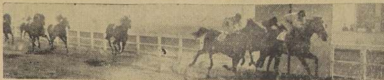
Old Times, delante de Dolly y Cana al Aire.

Iniciado el movimiento, Lapidario lució sus colores al frente, vigilado por Full de Ases, escalonándose a continuación Guardanico, Ernestina, Alumno, Andanada, Bolito, Aquelella, Arlette, Quitucha y Angelico, con Marco Polo cerrando la marcha a enorme distancia.