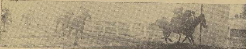
Hilachita bate estrechamente a Peteca y Old Master.

Premio NORMANDIA.— 1.500 metros.— Para caballos de tres años y más ganadores.— Handicap.— Inscripción: $ 45.— Premio: $ 4.500 al 1.º.