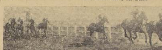
Marcha Real aventaja a Vadarkablar y Comendador.

En plena curva, Cana al Aire pasó a la delantera, entrando a la recta con un cuerpo sobre Comandante, Pedrada, Old Times, Nacelle y My Dolly, y mantuvo sus posiciones hasta 150 metros para la raya, en donde Old Times se hizo presente, pasando luego al frente y resistiendo sin mayor esfuerzo la tropellada de My Dolly, a la que derrotó por un pequeño. Tercero, a media cabeza, Cana al Aire, delante de Pedrada, Yuste, Water Polo, Nacelle y El Monarca. Últimos, Comandante, Chop y Bagatela.