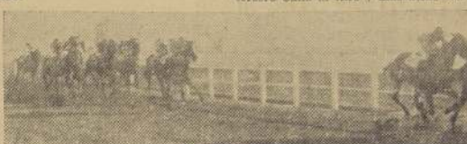
Asimica da cuenta de Baqueana y Odesa.