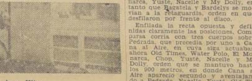
Cantafior aventaja estrechamente a Nitocris y Wico.