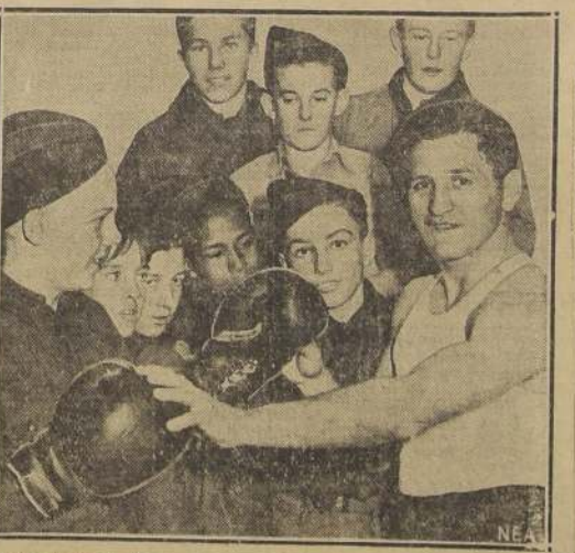
Young Corbett, el gran peso welter californiano, que durante el año pasado venció a dos campeones mundiales, aparece aquí enseñando el noble arte de los puños a los boy-scouts de San Francisco, de quienes es instructor de box.

GERENCIA: CATEDRAL 1433 — CASILLA 1111 — TELEFONO 65493 — SANTIAGO Hay Bonos de cinco, diez, veinte, cincuenta y cien pesos, para préstamos de: cinco, diez, veinte, cincuenta y cien mil pesos. Es la inversión que reúne los mayores requisitos de previsión. Al adquirir usted un bono de estos, puede obtener un préstamo mil veces superior al valor de él.