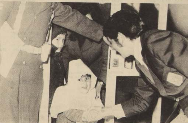
CHAMACO VALDES.- El jugador internacion- al saluda a una de sus hi- jitas en el recinto adua-

En general todos los jugadores coinciden en que su actuación estuvo dentro de lo normal, recalcando que es cierto que hu- bo superación de algunos joga- dores que no salieron de Chile con el respaldo general y amplio.