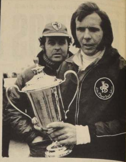
EMERSON FITTIPALDI primera opción en GP de Francia