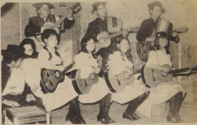
Conjunto Folklórico "Graneros".

El viernes 30 de junio se presentarán, auspiciados por la Facultad de Ciencias y Artes