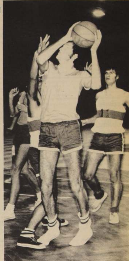
LA ESCENA VUELVE A REPETIRSE hoy en Recoleta y en el Nataliel. Nuevamente se enfrentan las Selecciones Universi- tarias.