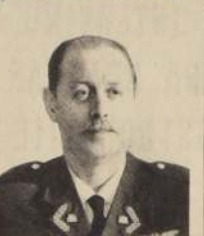
ASCENSO DE DOS GENERALES DE LA FUERZA AEREA

Cumpliendo este ofrecimiento se encuentra ya en Ministerio de Educación el Material didáctico que se entregará a esta Escuela junto con la ampliación realizada por la Sociedad Constructora de Establecimientos.