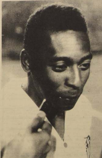
PELE: gran ausente en el scratch brasileño que hoy enfren- ta a la selección de Checoslovaquia.