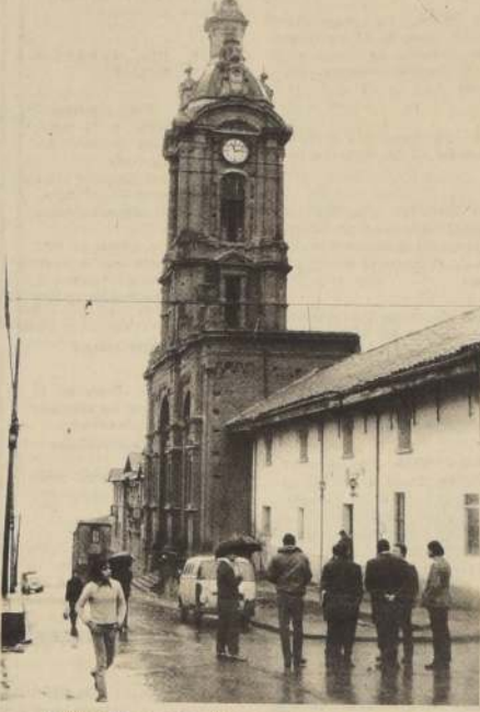
La Iglesia San Francisco del cerro Barón, cuya alta torre sobresale en la topografía porteña, será iluminada por la Municipalidad de Valparaíso con lo cual no solamente podrá ser vista de noche desde cualquier punto de la ciudad, sino desde el mar y la bahía. La Iglesia y antiguo Convento Franciscano es otra de las reliquias históricas del primer puerto.

ARCALAU CORONEL ARANEDA Director General