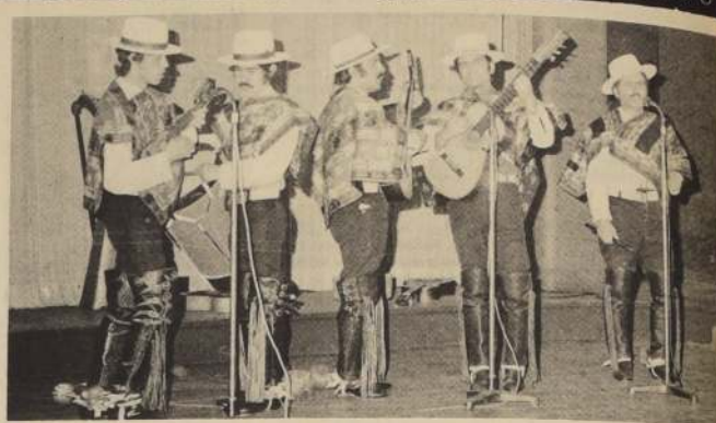
Los Montaneros, grupo familiar que triunfa con su Show folklórico internacional en el Casino Municipal y que cosecha aplausos en cada una de sus presentaciones.

Corresponsalía del Diario "La Nación" Condell 1281 Teléfono 507.78