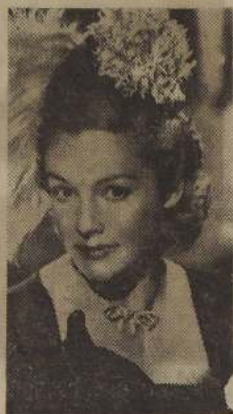
Ex actriz Madeline Carroll