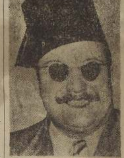
Ex rey Farouk, de Egipto

CAPRI, 13 (UP).— El ex Rey Farouk y la ex Reina Farouk se van a mudar hoy a un hotel de segunda categoría, en Santa Marinella, en la Italia continental, 35 millas al Noroeste de Roma. Farouk, quien se ha descrito como "un hombre pobre" desde que fue derrocado y privado de la mayor parte de sus propiedades, ha logrado cuartos en la "Villa de Palmi", a precio de fuera de temporada. En todo el apogeo de la temporada el precio es de cinco dólares diarios por cuarto. El secretario de Farouk ha denunciado que el ex monarca haya comprado la villa en Santa Marinella. El secretario dijo: "La familia permanecerá en el hotel por un tiempo indefinido, hasta que pueda encontrar una residencia permanente en el exilio que le guste. El ex Rey Farouk y su familia probablemente se irán de Capri, dentro de cuatro o cinco días". El director de cine italiano, Roberto Rossellini y su esposa Ingrid Bergman, mantienen su hogar en la ciudad-balneario de Marinella.