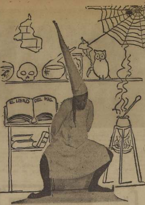
"EL DIABLO, DISFRAZADO DE NIGROMANTE", personaje de "Pierrot y su sombra", pantomima clásica al estilo de la "Comedia del arte", que será estrenada por la Cia. de Alejandro Jodorowsky el jueves 23 en el Petit Rex, en vermouth y noche