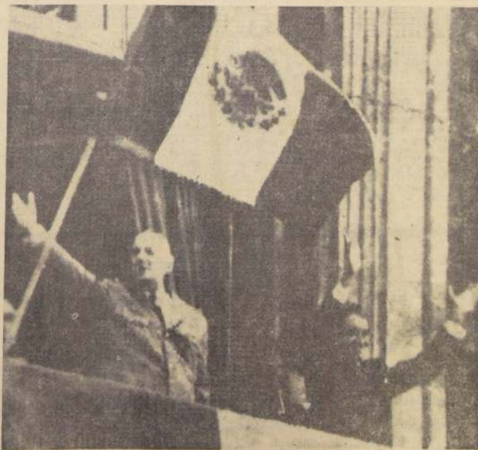
CIUDAD DE MEXICO. — El Presidente Charles de Gaulle (izquierda) y su colega mexicano, Adolfo López Mateos, en un momento de su recepción en el aeropuerto de Ciudad de México, donde De Gaulle disfrutó de una multitudinaria recepción. El Mandatario mexicano cumplió en este viaje su primera gira por América Latina. La segunda se realizará en septiembre, cuando alcance a Argentina, Brasil, Perú y Chile.