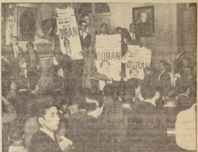
MANIFESTACIONES DURANISTAS. — No bien las emisoras santiaguinas informaron ayer sobre la renuncia presentada por el senador Durán a su candidatura presidencial, numerosos grupos de manifestantes empezaron a reunirse en los locales de los partidos del Frente Democrático, reiterando su incondicional adhesión al señor Durán. En la foto gráfica, uno de esos grupos en el local del Partido Conservador.