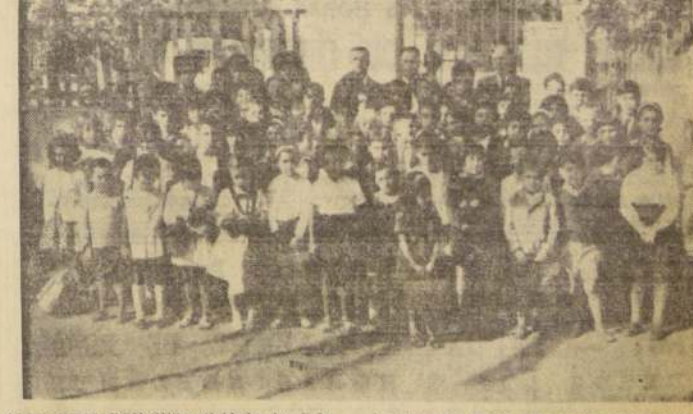
AYER INICIARON SUS actividades los Colegios de las Iglesias Mormonas en Chile, con 82 alumnos en Santiago y 79 en Viña del Mar. La Iglesia de Jesucristo de los Santos de los Últimos Días entrega en sus dos colegios instrucción primaria del 1.º al 6.º año al alumnado mixto. Su programa de enseñanza incluye máquinas de lectura, bioscopios e instrumental para cursos científicos en que

publica, sobre los resultados de la elección de Curricó y su significación en la vida nacional. No adelantó detalles acerca de la misma, pero otros dirigentes manifestaron que en dicha declaración, la Democracia Cristiana rebatiría las afirmaciones del FRAP sobre su penetración en el campamento de Curricó.