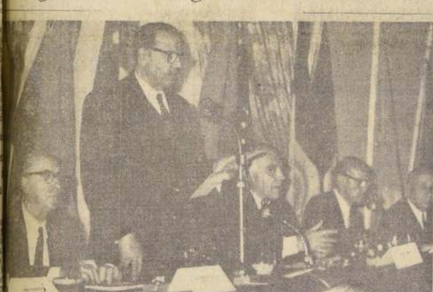
Se efectuó en el Hotel Carrera la inauguración de la Décima Reunión Anual del CICYP, con la asistencia de 150 delegados y 350 chilenos. En el grabado, el ministro del Interior, Sótero del Río, al pronunciar la palabra, a nombre del Gobierno, a los delegados asistentes. A la izquierda del ministro, Recaredo Ossa, presidente de la Confederación de la Producción y el Comercio, y a la derecha, el presidente saliente del CICYP, senador Pedro Ibáñez.

A los hombres de empresa les incumben obligaciones indiscutibles: extremar sus iniciativas y su celo para hacer prosperar sus actividades y la economía general, a fin de que prosperen los mejores y crecientes recursos que aumenten el bienestar de la colectividad, manifestó ayer el ministro del Interior, Sótero del Río, durante la inauguración de la Décima Reunión Plena del Consejo Interamericano de Comercio y la Producción.