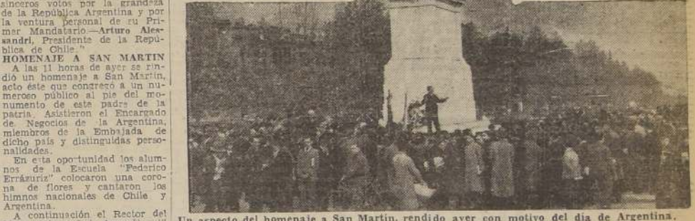
Un aspecto del homenaje a San Martín, rendido ayer con motivo del día de Argentina.