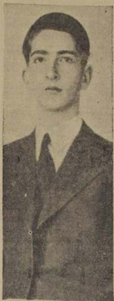
El Rey Pedro II de Yugoslavia.

Su Majestad Pedro II de Yugoslavia, el rey más joven del mundo, celebra hoy sus quince años de edad. Nació en Belgrado, capital del reino, el 6 de septiembre de 1923. Es hijo de Alejandro I,