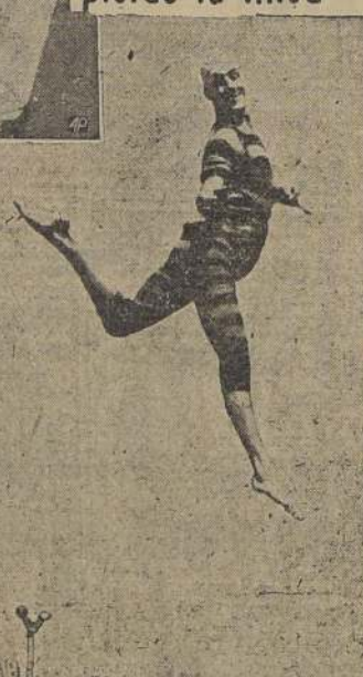
Frier huevos con el calor del