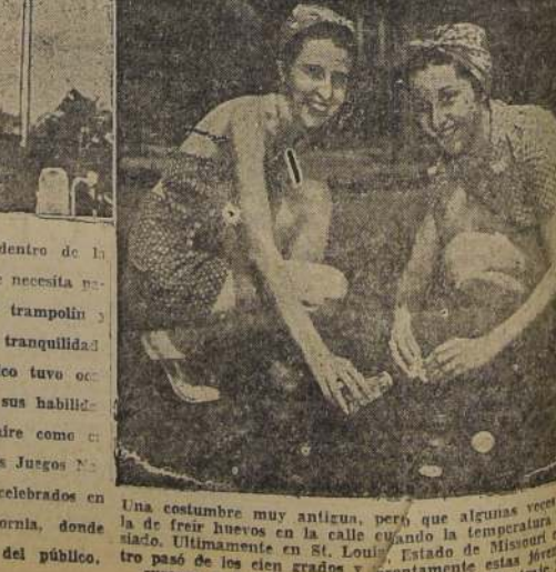
Una costumbre muy antigua, pero que algunas veces se la de freír huevos en la calle cuando la temperatura es muy alta. Últimamente en St. Louis, Estado de Missouri, el pueblo pasó de los cien grados y prontamente estas jóvenes se apresuraron a freír huevos en la acera. ¡Y una traja!