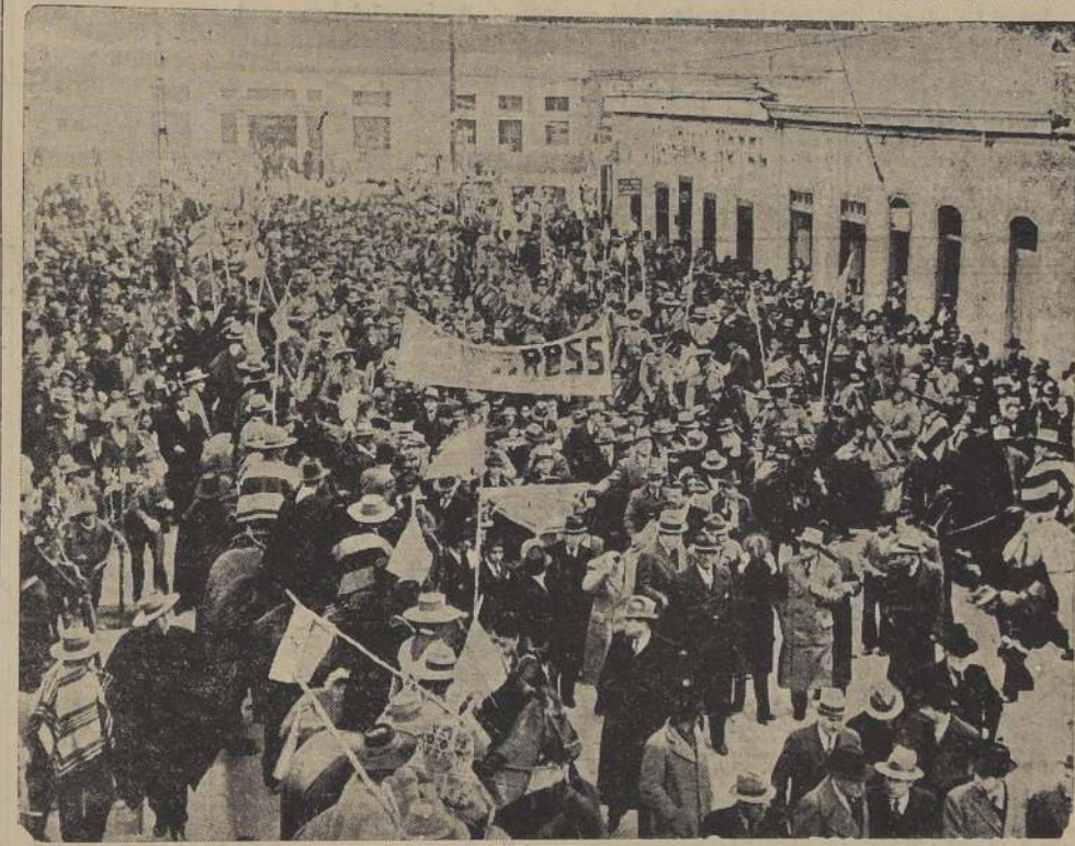
Los aspectos de la imponente recepción ofrecida ayer por el pueblo de Curicó al candidato nacional a la Presidencia de la República, señor Gustavo Ross Santa María.

A causa de las alarmantes noticias recibidas desde la capital, el señor Gustavo Ross puso término a las 15.40 horas de ayer, en la ciudad de Curicó, a la jira que realizaba por esa provincia y la de Talca, como parte de su campaña electoral. A la hora indicada, el tren especial en que viajaba el candidato nacional a la Presidencia de la República emprendió el viaje de regreso, acompañado de una parte de su comitiva. El resto de sus acompañantes quedó en Curicó, presidiendo el banquete popular que allí se realizaba y con el objeto de cumplir el resto del programa de la jira, que comprendía recepción, desfile y proclamación en la ciudad de Molina; manifestación ofrecida por las señoras de Curicó y comida social en el club de esta última ciudad.