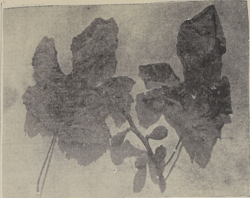
Flores y frutos atacados por la "arañita roja". Obsérvense las hojas en plena enfermedad

La explicación que antecede, prueba que no hay tal "envenenamiento" de esta fruta, sino la epidemia del parásito llamado "arañita roja".