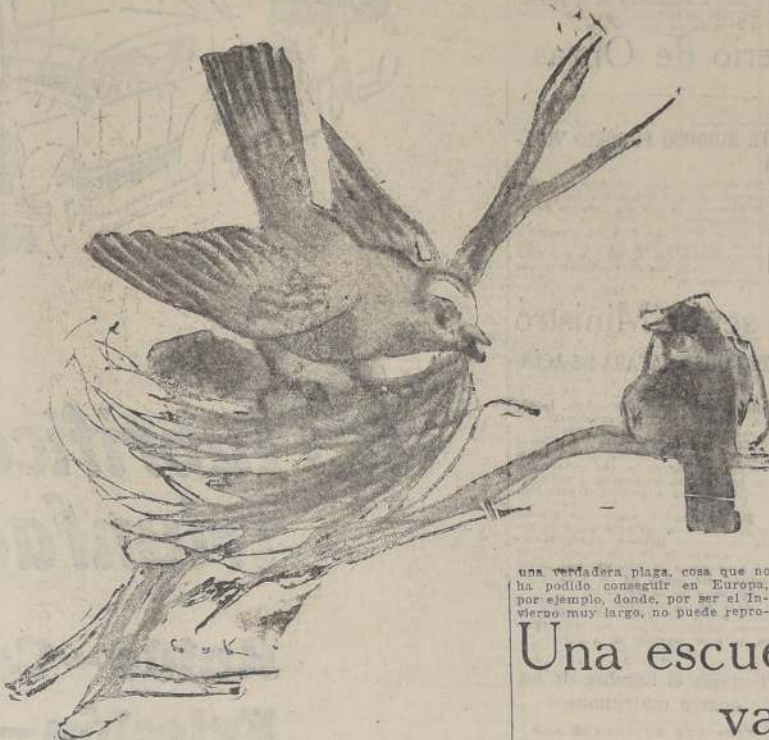
Una verdadera plaga, cosa que no ha podido conseguir en Europa, por ejemplo, donde, por ser el invierno muy largo, no puede reproducirse.

Nos dice el señor Opazo que el gorrionero es un ave sumamente belicosa y que, viéndose ya en poderosa y larga familia, emprendió una tenaz y enconada persecución contra sus semejantes pequeños: el chero, la diuca, el chincho y el jilguero. En resumen: contra todos los pajaritos netamente criollos, los que daban a las eternas y tristes mañanitas invernales un beso de vida y alegría al despertar.