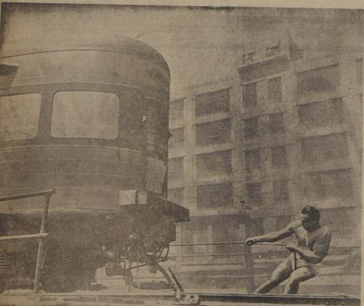
NUOVA YORK, E. U. A. — En los patios ferroviarios de Sunnyside, en Long Island, Charles Atlas de Nueva York, "El hombre más perfectamente desarrollado del mundo", demostró su gran fuerza muscular delante de un grupo de periodistas y fotógrafos, arrastrando sobre los rieles uno de los vagones de observación del Ferrocarril de Pennsylvania, vagón que pesa 66 toneladas.