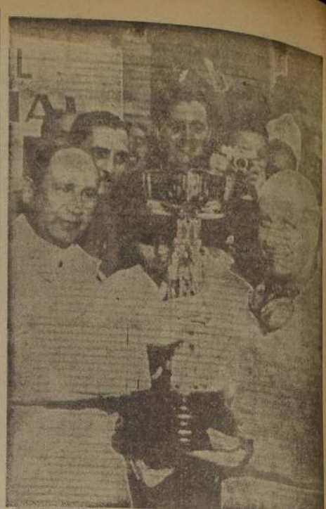
GRAN PREMIO. — Juan Manuel Panglo, campeón mundial de automovilismo, recibe el trofeo de la victoria de manos del señor Santa Rosa, presidente del Automóvil Club del Brasil. Panglo ganó el domingo el Gran Premio de la Ciudad de São Paulo disputado en el aeródromo de Interlagos.

Recién recibidos: Banda blanca con telas nylon y banda negra de caucho natural. 650 x 15 670 x 15 710 x 15 800 x 15 820 x 15 825 x 20 1.100 x 20 Y EN BANDA BLANCA HAY EN EXISTENCIA: 670 x 15 y 820 x 15 Cámaras en todas las medidas especiales contra recalentamiento. Entrega inmediata a precios oficiales. SE ATIENDEN PEDIDOS DE PROVINCIAS ARTURO PRAT 179 - CASILLA 4180 Teléfono 65791 — Santiago-Chile.