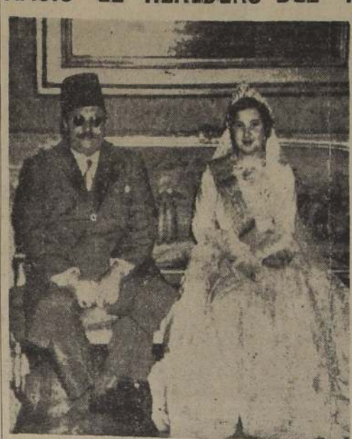
Soberanos de Egipto, Faruk y Narriman, cuyo hogar ha sido alegrado con la llegada del esperado heredero del trono, Ahmed Fuad.