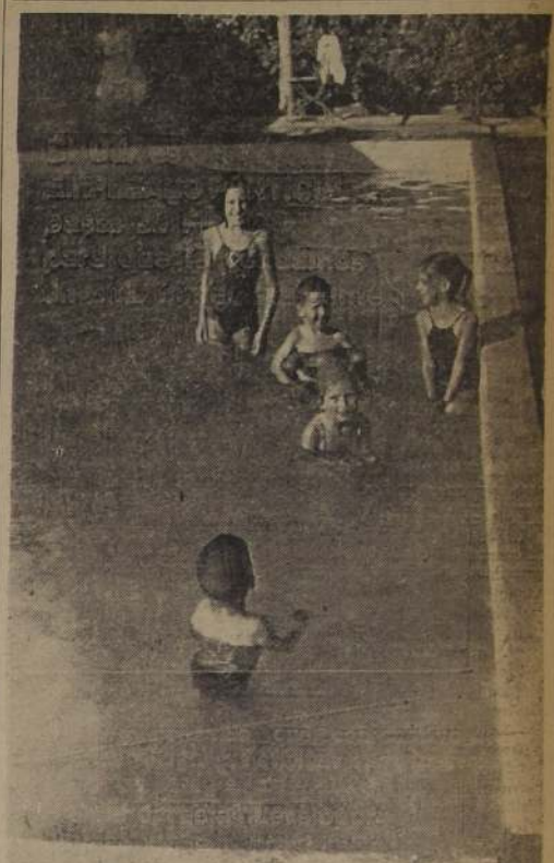
PISCINAS BAJAS PARA NIÑOS. —Esta es una de las pocas piscinas para niños que ha encontrado LA NACION. Deberían existir más pero también debería haber un encargado de ellas, que además de enseñar a nadar, cuidara de los pequeños que, al igual que sus padres, sufren de los calores del verano.

La muerte de cuatro personas ahogadas en diferentes piscinas de la capital en los últimos primeros días del año movió a LA NACION a visitar diferentes piscinas con el fin de ver las medidas de seguridad que en ellas se adoptan. Encontró que en sólo una había un encargado que posea el título de Salvavidas y que en la gran mayoría no hay ni siquiera un flotador de corcho. Las reglamentaciones por las que se rigen las piscinas nada dicen al respecto. Sólo se preocupan del aspecto sanitario.