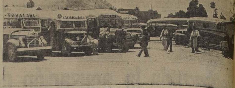
MIENTRAS EL PUBLICO ESPERA A MEDIODIA.— Mientas el público espera bajo el sol, en los terminales los moventes Tobalaba están inmobilizados como lo muestra la fotografía tomada al mediodía en Mapocho. Esto mismo ocurre con la línea Tropezón y otros recorridos. Las autoridades del tránsito parecen ignorarlo.