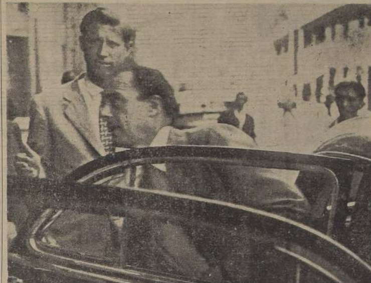
ULTIMO VIAJE DE ALI KHAN EN SANTIAGO. — Ayer, a las 14.25, hizo su último viaje en automóvil por Santiago el Príncipe Ali Khan, hijo del jefe espiritual de millones de musulmanes. Fue para trasladarse del hotel al aeropuerto. En el grabado vemos al Príncipe en el momento en que sube al automóvil y mira hacia un grupo de curiosos que lo saludan.