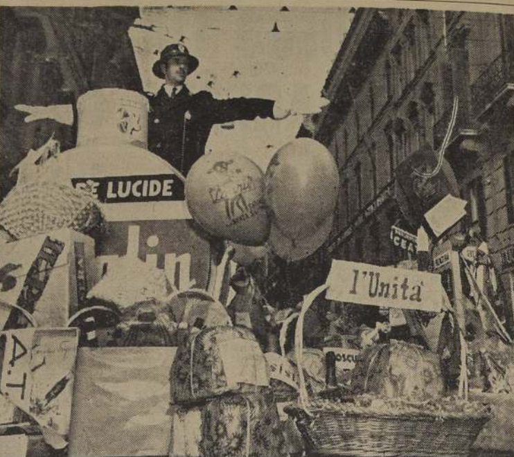
POLICIA MUY REGALADO. — ROMA. — Con los regalos amontonados a sus pies, un policía en Roma dirige el tránsito con un aire benevolente, en vista de que los regalos son provenientes de los choferes de la ciudad, que buscan bondad y buen tratamiento, de acuerdo con una larga tradición de paz el Día de la Epifanía. Los choferes esperan que los policías sean benevolentes en los futuros contratiempos del tránsito al aceptar los regalos.