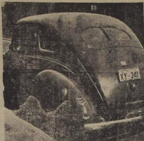
LO ROBARON Y DESPUES QUEDO ABANDONADO.—Este coche fue uno de los que robaron el año pasado los jóvenes de cuello duro y corbata tejida. Pasaron durante dos días y después lo dejaron en la esquina con Compañía, frente a la LAN. Una espesa capa de polvo lo cubría cuando lo halló la policía. En sus aparatosos huecos evidentes señales de choques y rasguños, provocados por las locas carreras de estos ladrones.