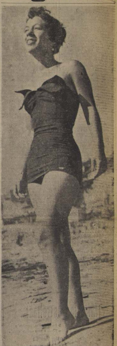
CARA AL SOL Y AL VIENTO. — De pie sobre la arena dorada, mirando hacia la lejania de los mares, esta linda bañista es como la expresión humana que resume la belleza juvenil de Chile. No importa su nombre. Ni interesa la playa en que la foto fue tomada. Pertenecer a la geografía de Chile, y la bañista es una mujer chilena que es, al fin y al cabo, lo que más interesa destacar.