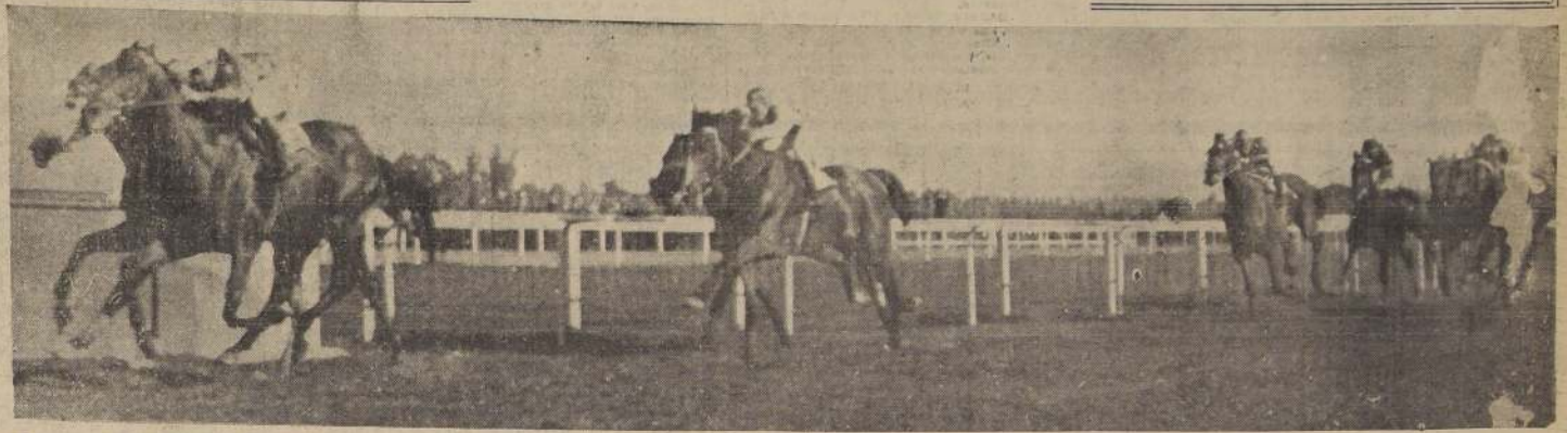
La sensacional llegada de "El Ensayo" de 1943, en donde el invicto Quemarropa logra mantener a duras penas, medio pescuezo de ventaja sobre el tordillo Meyerling que en la fotografía se ve en una línea con él. Este efecto se produce debido a que el favorito se abrió en los metros finales y nuestro fotógrafo está a algunos metros pasado la meta. El tercer lugar a dos cuerpos lo obtiene Rey Perico delante de su compañero de techo Relincho. 5.º Kunihiko que se defiende bravamente de Cedron y Nereida

ANTE GENERAL EXPECTACION, QUEMARROPA LOGRA EL TRIUNFO EN "EL ENSAYO"