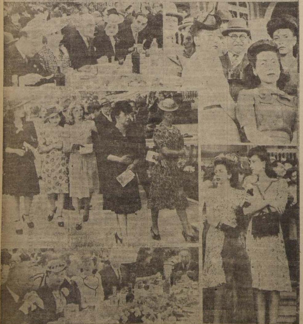
Una fiesta de magníficos relieves constituyó la reunión de ayer en el Club Hípico de Santiago con motivo de correrse "El Ensayo". S. E. el Presidente de la República, y destacados elementos sociales fueron festejados por el Directorio de la institución con el tradicional almuerzo que se ofrece en este día y las distintas dependencias del Club ofrecieron un magnífico aspecto, totalmente ocupadas por una numerosa y distinguida concurrencia una noche una tarde agradable en nuestra primera institución hípica.