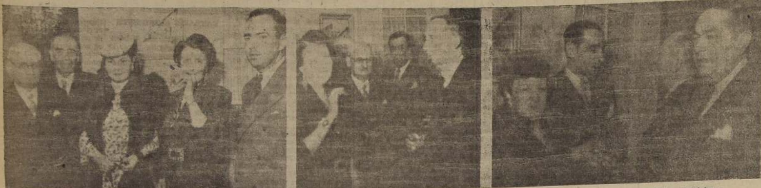
Impresiones tomadas por nuestros Fotógrafos durante la recepción ofrecida ayer en la Legación de la República Dominicana.