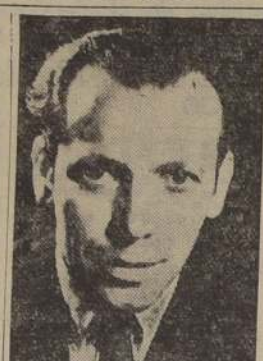
El profesor don Humberto Díaz Casanueva

Desde hace algunos días se encuentra en Santiago, de regreso de Alemania, donde permaneció en comisión de Gobierno, durante el profesor señor Humberto Díaz Casanueva. En la Universidad de Jena, obtuvo su doctorado en Filosofía y Ciencias de la Educación, con una Tesis sobre "La imagen del hombre en la filosofía de Ortega y Gasset y sus relaciones con la Ciencia de la Educación", estudio que constituye lo más completo y sistemático que se ha escrito sobre el filósofo español. Aparte de sus estudios profesionales, el señor Díaz Casanueva realizó importantes investigaciones en el campo de la literatura y del arte.