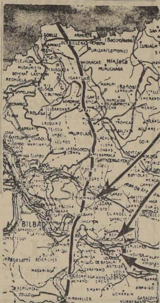
Mapa del frente de Vizcaya, en el cual pueden observarse las zonas donde se libraron ayer combates. Según las últimas informaciones, las fuerzas nacionalistas habrían abierto una enorme brecha en la última línea de defensa vasca.

El día 20 de mayo, Mola envió un ultimátum a Bilbao que decía: "Rindáse o serán destruidos". El día 21 de mayo, Mola envió un ultimátum a Bilbao que decía: "Rindáse o serán destruidos".