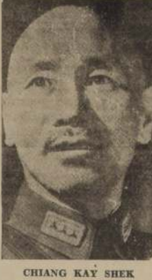
CHIANG KAY SHEK