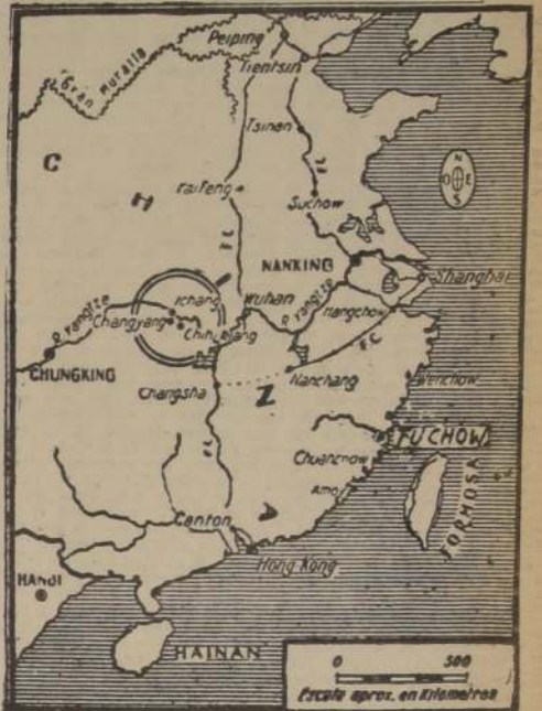
Fuerzas chinas ocuparon el puerto de Fuchow, posiblemente para emplearlo como punto de recepción de material de guerra enviado por los aliados a través del Pacífico.

Informaciones recibidas de Suecia dicen que el doctor Werner Best, representante personal de Hitler en Dinamarca, ha pedido permiso para entrar a Suecia, pero que le ha sido negado.