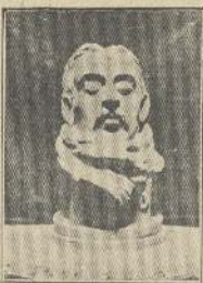
Mascarilla de Acevedo, obra del mismo artista.

mera ciudad, en la que se encontraba el Bío-Bío.