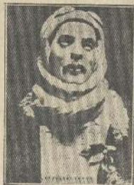
Busto completo de Acevedo: obra de Oscar N. García G.

hizo notar la insignia de la patria por encima de los valles verdugueados y de los desiertos solitarios. Se le amaba porque a un puñado de miserables prisioneros, bandidos recogidos en las guaridas de sus desmanes, fué a llevarles una nota alegre accediendo a su pedido; se lo quería porque en un día muy sereno y muy hermoso, deslumbró con su aparato a millares de ejércitos que le seguían en sus giras por el éter distante de aquella tarde de Noviembre. Después cuando bajó en el Club Hípico fué a contemplar de cerca esos millares de inocentes criaturitas de las escuelas públicas y era de ver en su semblante aquella sonrisa de inefable delicia cuando al pasar se veía aplaudido por nubes de sonreídas mejillas que apenas sobresalían del suelo! Por eso lo amábamos todos! Y porque lo queríamos se fué. Las proezas de otros aviadores le impulsaron a buscar mayor gloria y creyó la estúpida idea de un viaje aéreo de Concepción a Valparaíso. Los ensayos empezaron. Hallábase en la pri-