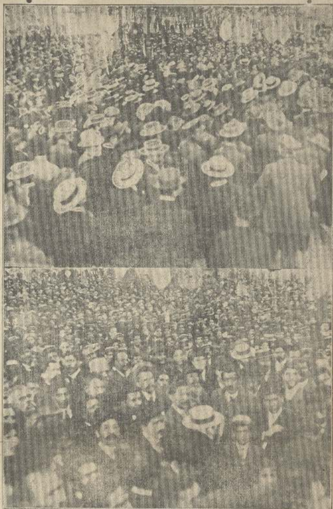
Diversos aspectos de la concurrencia que asistió ayer al meeting celebrado en la Alameda de las Delicias al pie de la estatua de San Martín.