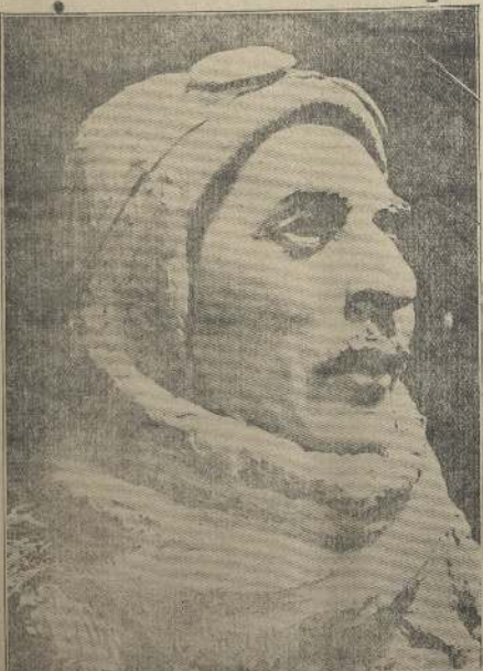
Busto de Acevedo, obra del escultor nacional señor C. Canot de Bon.