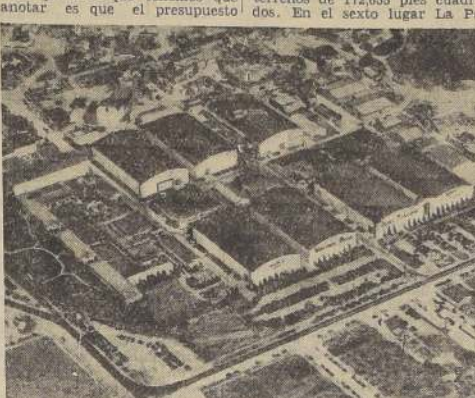
Vista de un sector de los Estudios Warner Bros

Una inspección hecha al finalizar el año 1935, sobre el terreno, ha dado los siguientes resultados en relación con la extensión de los Estudios Cinematográficos establecidos en Hollywood. Lo primero que tenemos que anotar es que el presupuesto